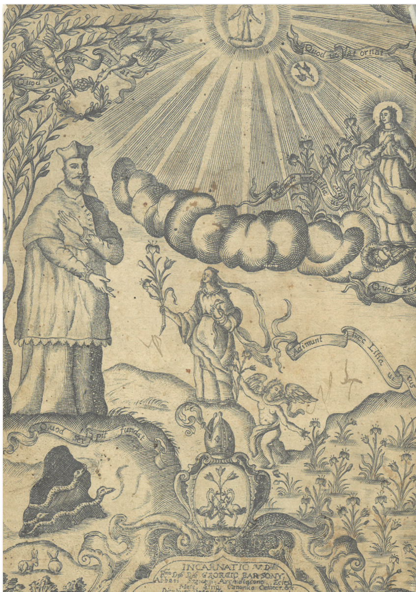
2. kép: Tatay Ferenc téziseinek rézmetszetes címlapja (Tyrnavia, 1661. – Pannonhalma, Főpátsági Könyvtár, 122-B-13)