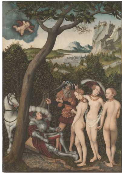
6. kép: Id. Lucas Cranach: Paris ítélete (1528 körül)