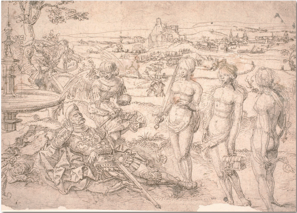
4. kép: Jan Gossaert: Paris ítélete , tollrajz