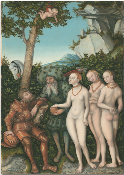
5. kép: Id. Lucas Cranach: Paris ítélete (1530)