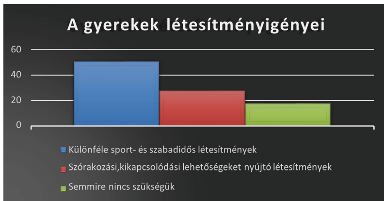
3. ábra: A válaszadók létesítményigényeit mutató ábra

Nemcsak a sporteszközigényeket mértem fel, hanem a létesítményekre is rákérdeztem, mi az, amit hiányolnak.