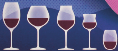
CABERNET BURGUNDI PINOT NOIR HEGEK TUMELLER