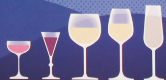
VINTEGE SHERRY CHARDONNAY ETHER PEZSO