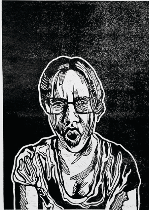
Tükör / linóleumnyomat (VIII.) / 70 x 100 cm / 2022