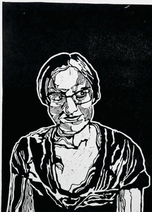
Tükör / linóleumnyomat (II.) / 70 x 100 cm / 2022