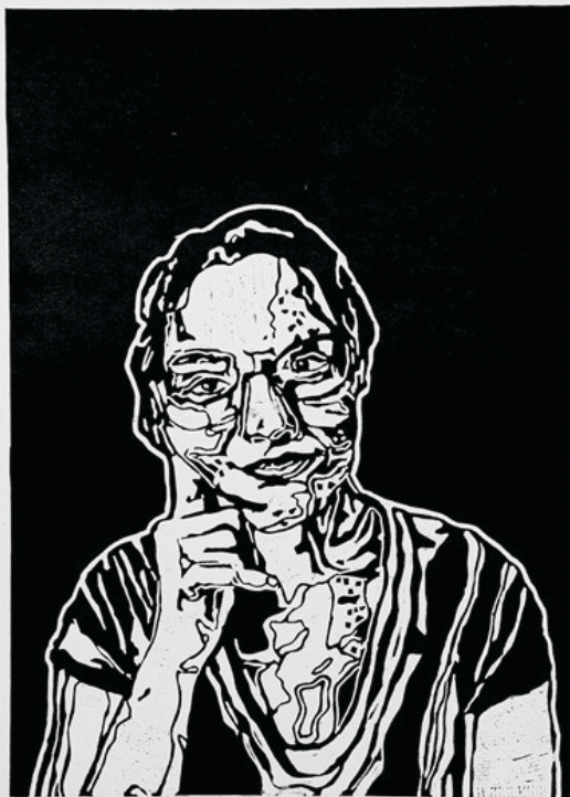
Tükör / linóleumnyomat (I.) / 70 x 100 cm / 2022