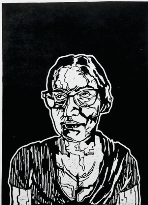
Tükör / linóleumnyomat (IV.) / 70 x 100 cm / 2022