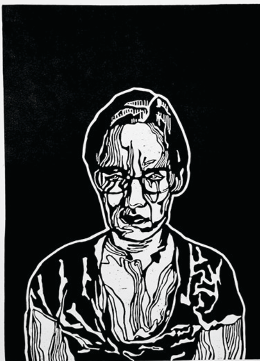
Tükör / linóleumnyomat (V.) / 70 x 100 cm / 2022