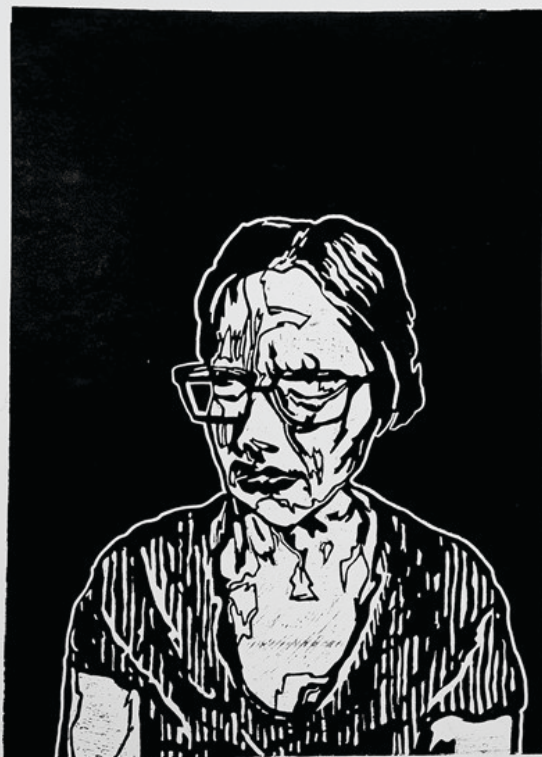
Tükör / linóleumnyomat (III.) / 70 x 100 cm / 2022