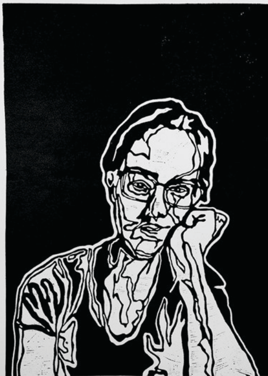
Tükör / linóleumnyomat (VII.) / 70 x 100 cm / 2022