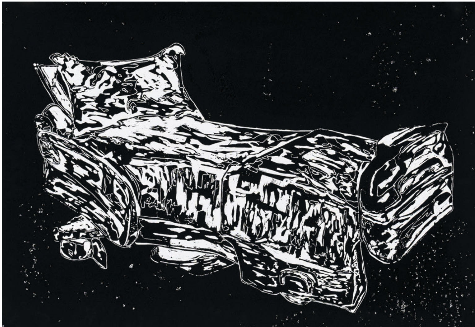
Épp ellenkezőleg III., 2022, kézzel nyomtatott fametszet, 70 x 100 cm