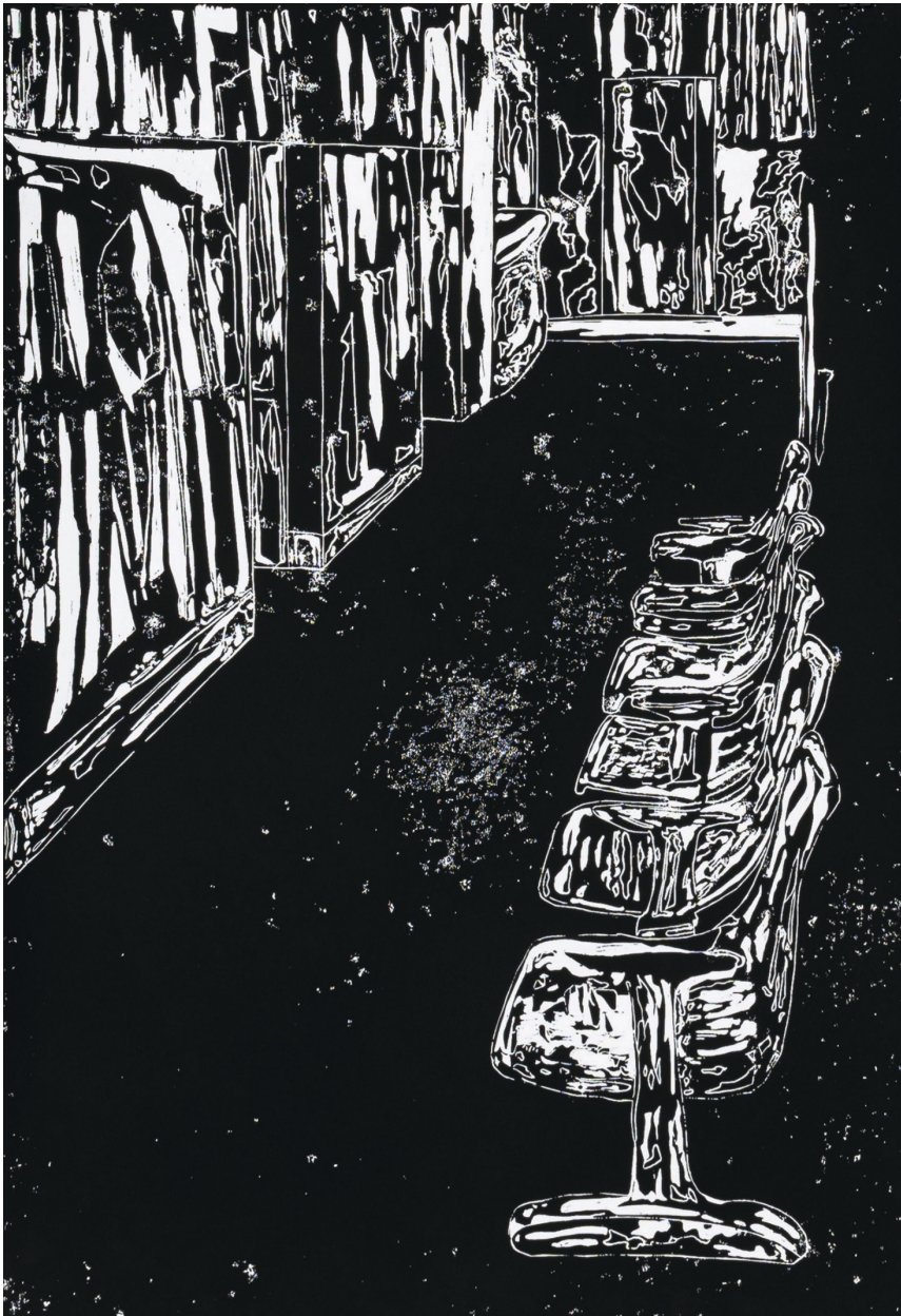
Épp ellenkezőleg I., 2022, kézzel nyomtatott fametszet, 100 x 70 cm