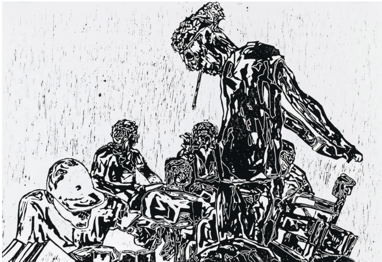
Épp ellenkezőleg IV., 2022, kézzel nyomtatott fametszet, 70 x 100 cm