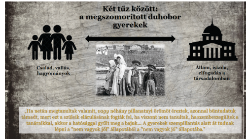
3. ábra. Plakát – hallgató munkája