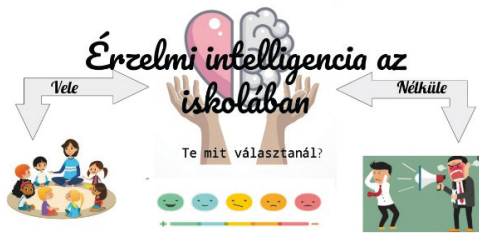
2. ábra. Plakát – hallgató munkája