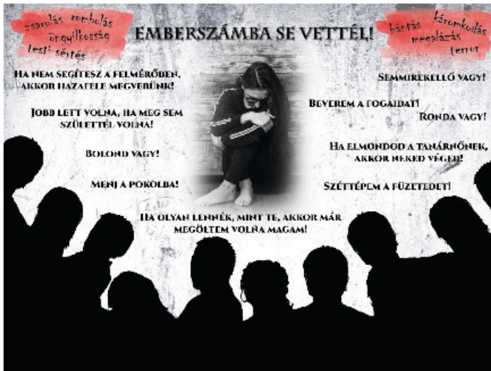
4. ábra. Plakátok Fülöpné Böszörményi Aliz Agresszió a gyermekintézményekben című tanulmánya alapján (hallgatók munkái)