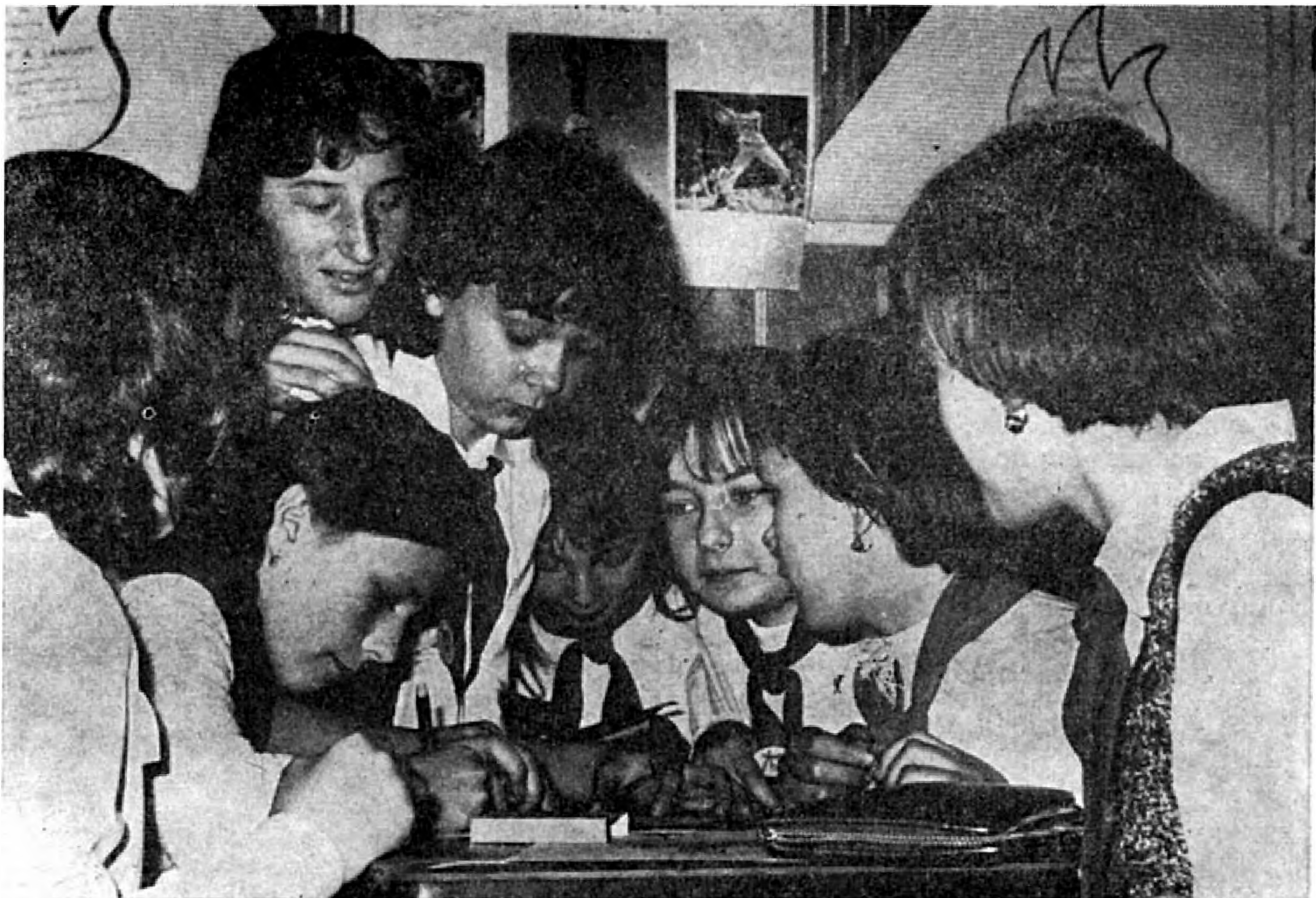
Az Ifjú Vöröskeresztes csoport tevékenységéből