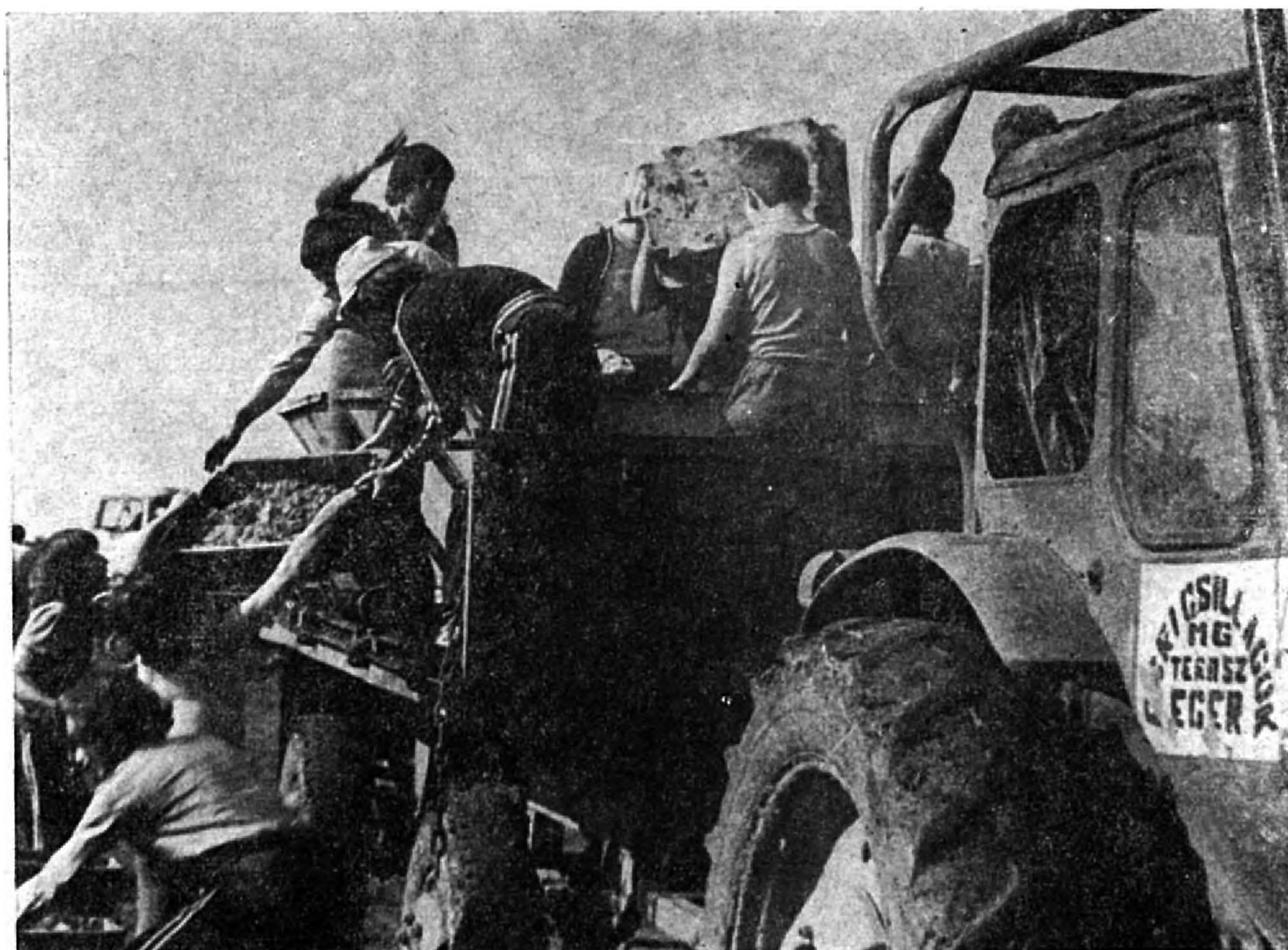
Szüretelés társadalmi munkában