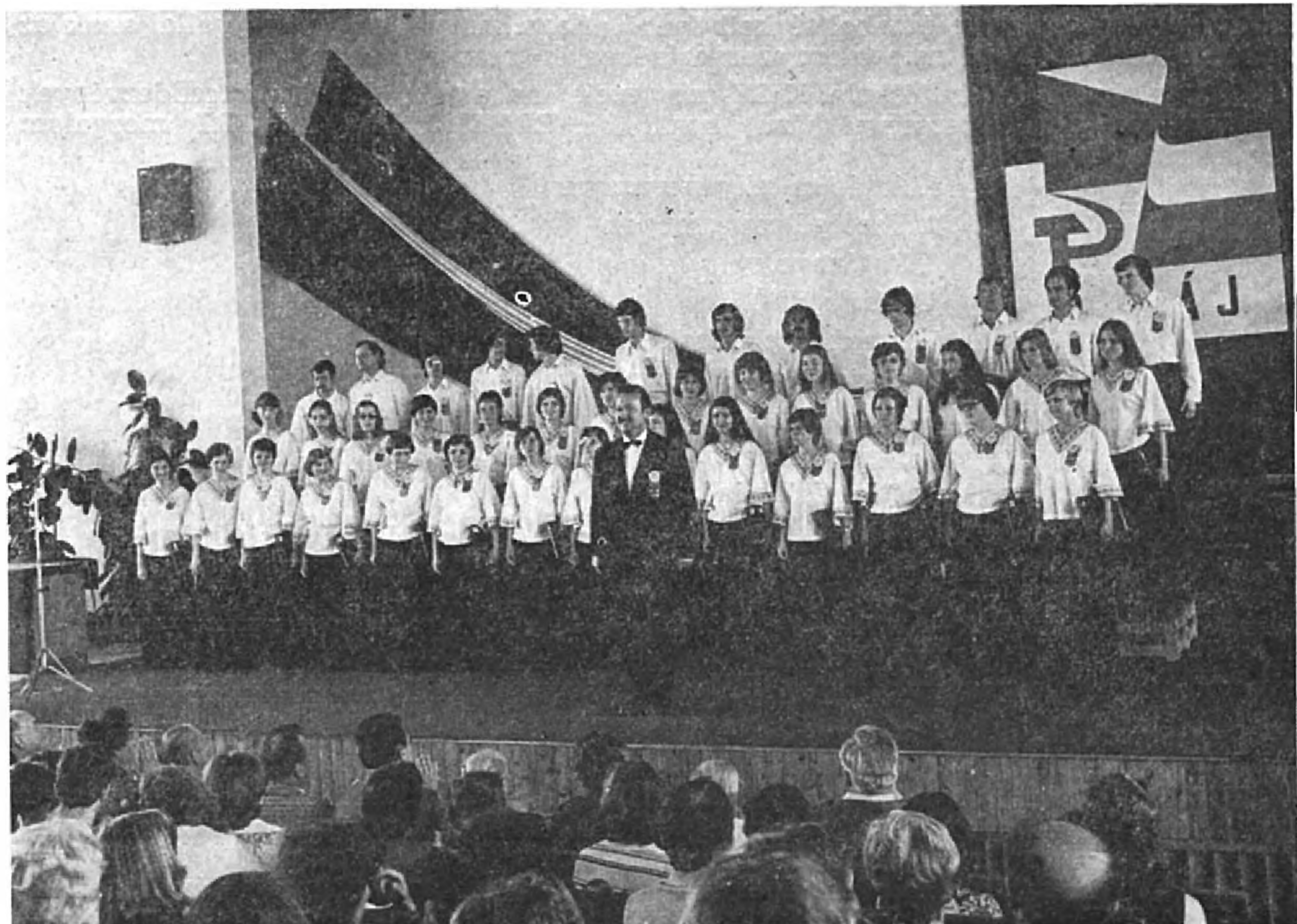
Vegyes karunk Besztercebányán.

Felléptek a főiskola minden emlékünnepségén.