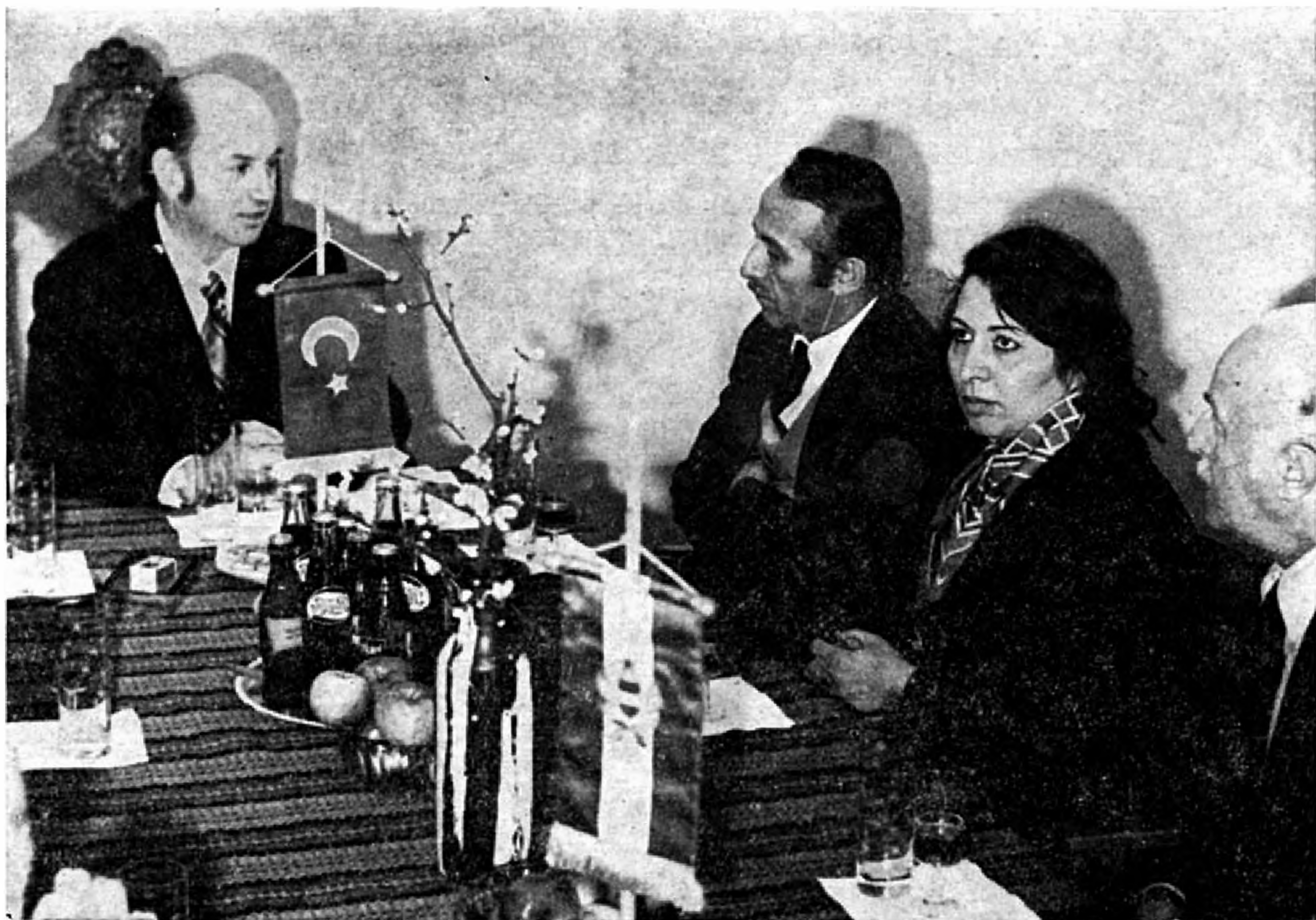
A török oktatási miniszter látogatása.