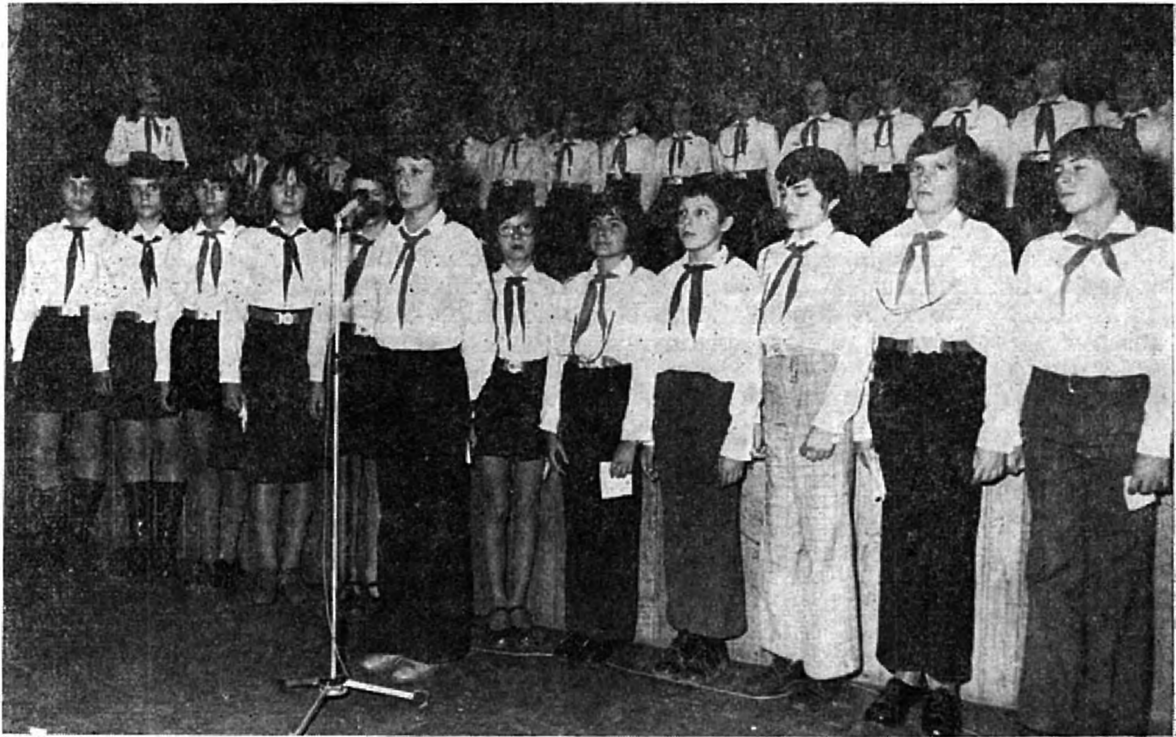
A 7. a osztály kórusa a november 7.-i ünnepségen.