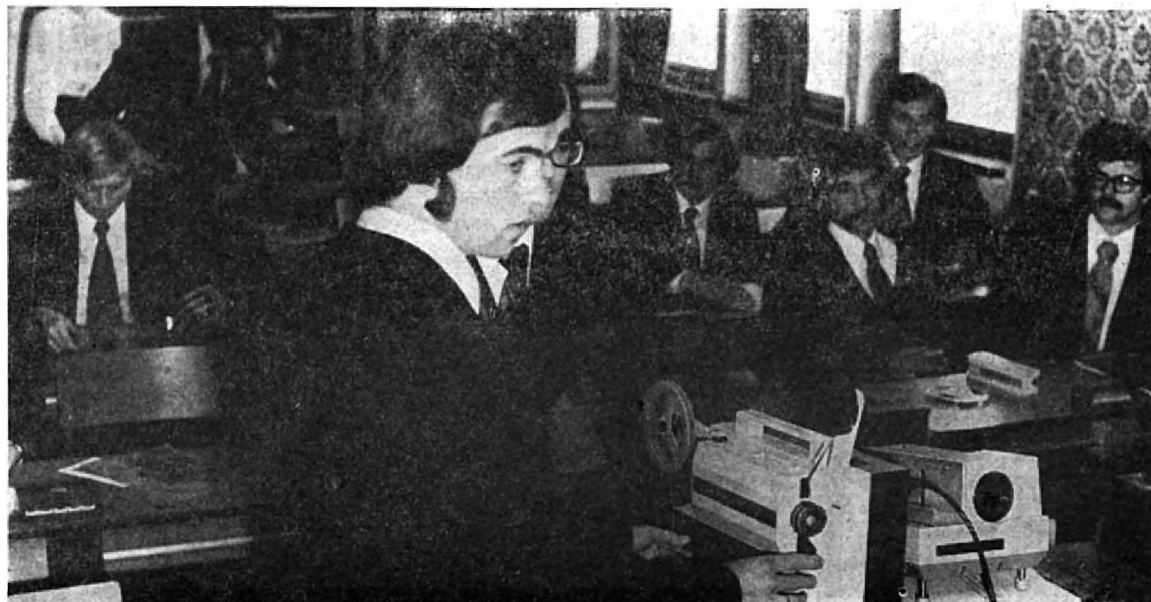
Az oktatástechnológiai szakkör munkában.