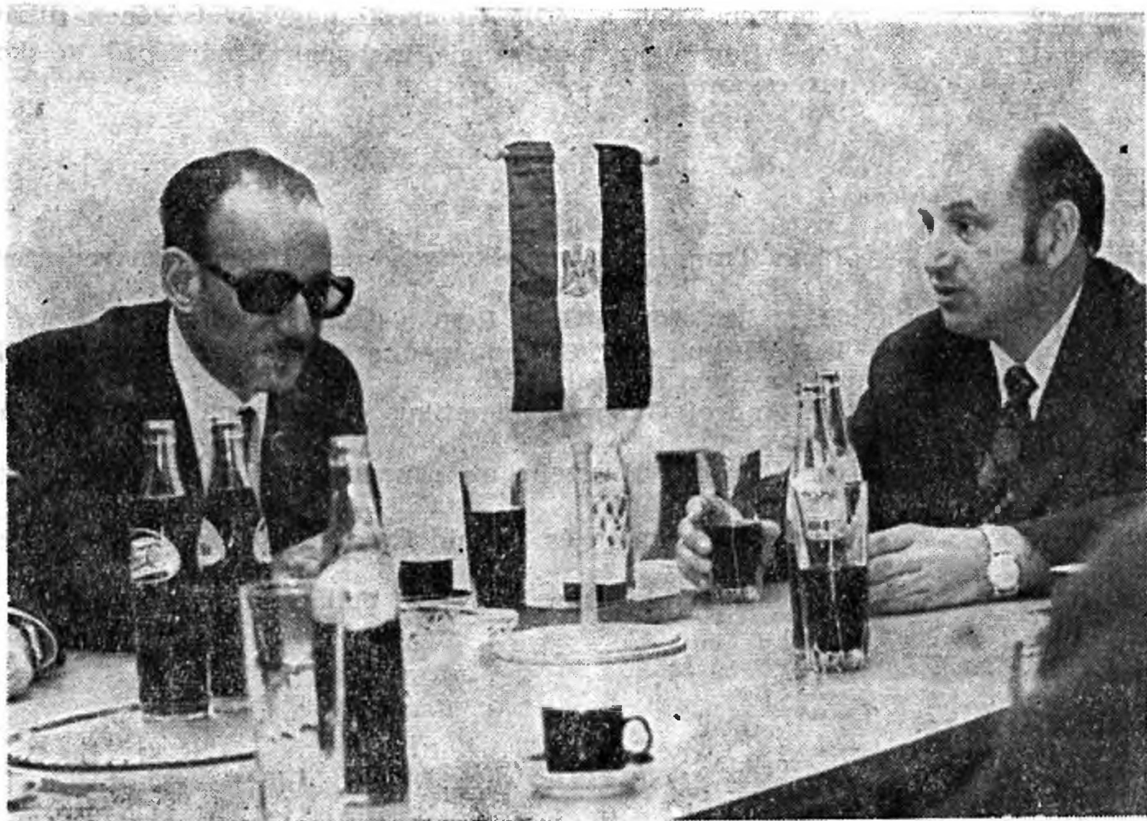
Az Egyesült Arab Köztársaság oktatási államtitkárának látogatása