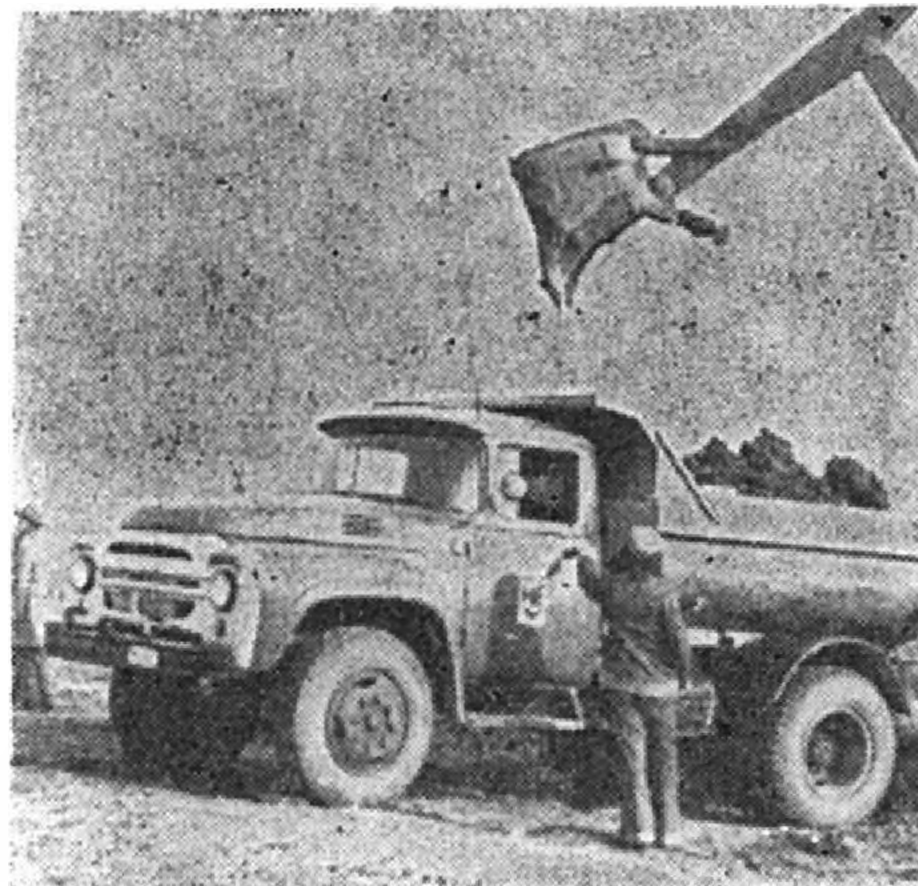
Az első „kapavágások” 1975.

Miután már egy éve megkezdődtek a főiskolai menza és természettudományi tanszéki épület közelében, az Almágyar dombokon a földmunkák, sor került a főiskola új, 144 személyes kollégiumának, központi raktárának ünnepélyes alapkövetételére.