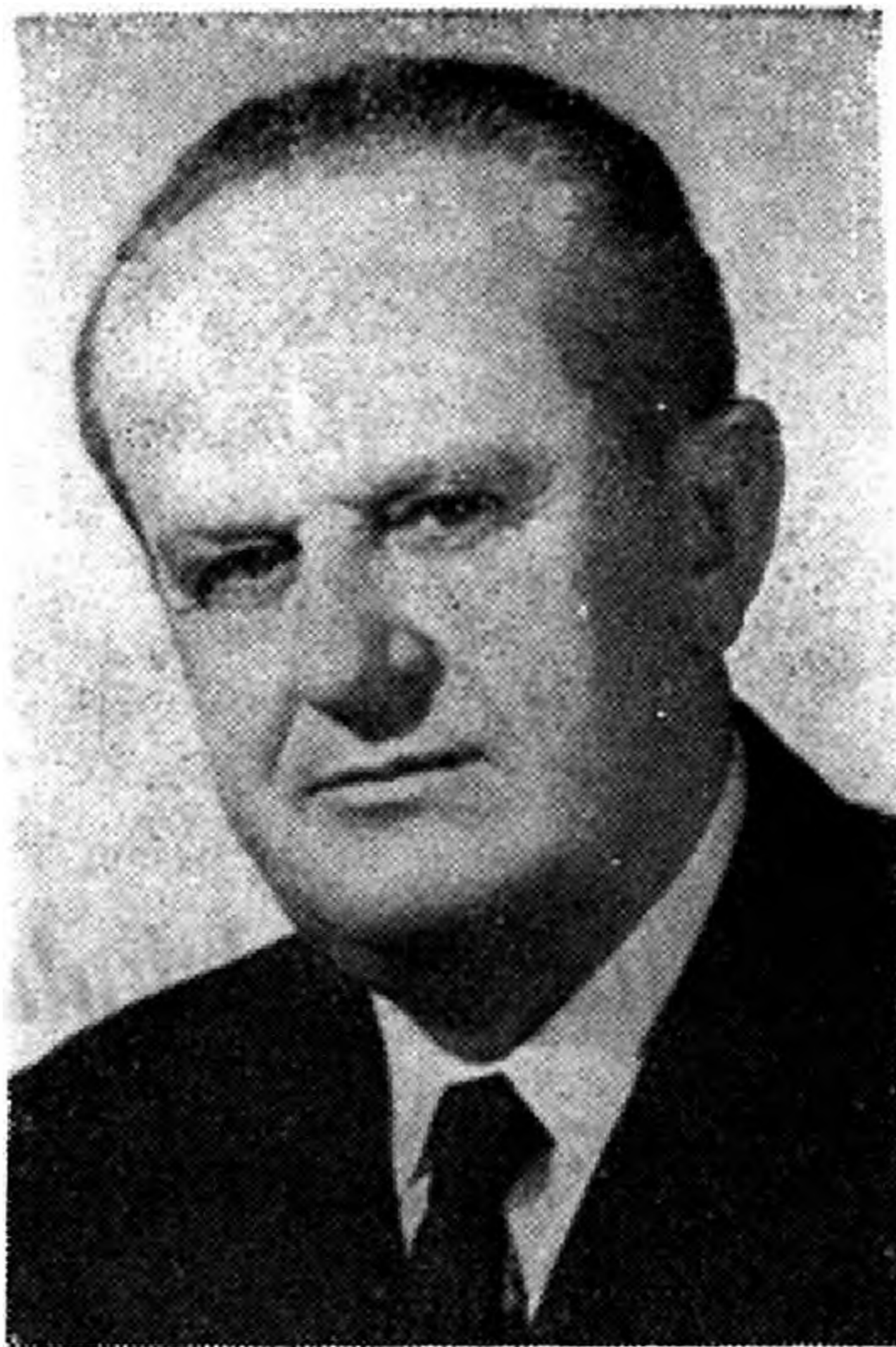
GÖMBÖCZ JÓZSEF (1908—1976. május 26.)

Az élet természetes kísérője a mulandóság. Azonban csak az múlhat el véglegesen, akire nem emlékeznek. Rájuk emlékeznek azok, akikkel együtt tanítottak, akik nagyon jól ismerték őket, akik sokat tanultak tőlük. Tanulták a szakma megbecsülését, a tanári pálya iránti lelkesedést, a munka megbecsülését, a gyerekek szeretetét.