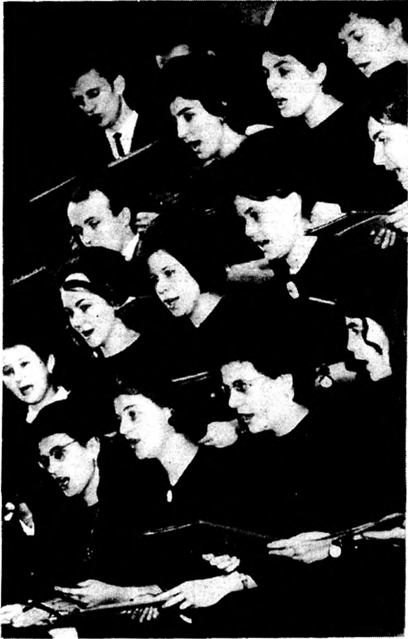
Főiskolánk kamarakórusa szereplés közben