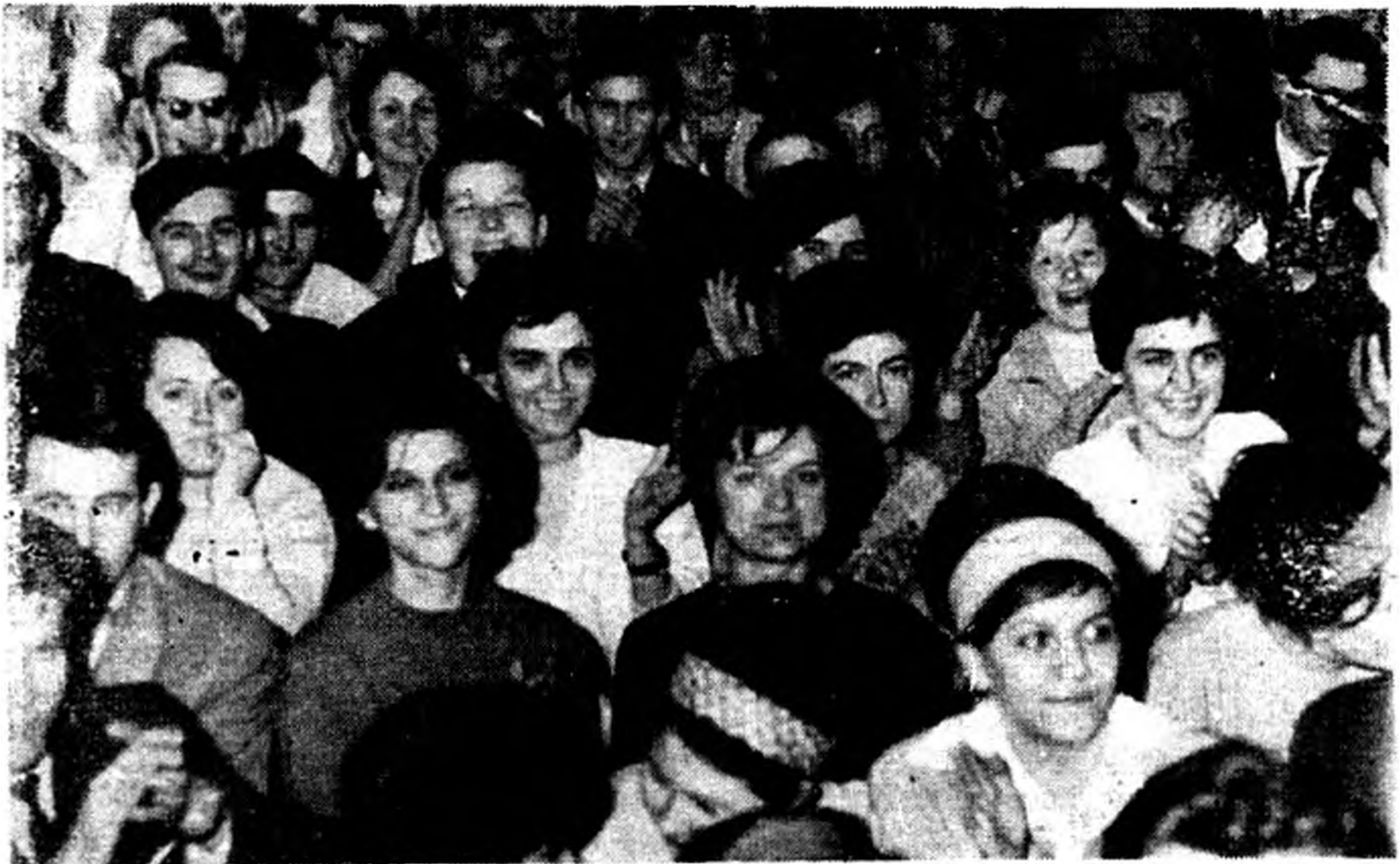
A fesztivál hallgatóságának egyik csoportja

Az egyetemisták, főiskolások kulturális fesztiválját Varga Ferenc, a városi tanács vb-elnöke, a fesztivál védnökségének vezetője nyitotta meg, majd megkezdődtek a bemutatók. 4—5 helyen egyszerre peregtek a számok. Daltól volt hangos a Gárdonyi Géza Színház, muzsikától a zeneiskola Bartók terme, szavalók mutatkoztak be a Gárdonyi gimnázium impozáns dísztermében, színjátások a Megyei Művelődési Házban... Sajnos, a szókincs szegényesnek bizonyult a látottak, hallottak leírására. A személyes élményt nem tudja pótolni a leírt betű! S nézőkben, hallgatókban nem is volt hiány. Főleg a társastánc és a tánczenekarok bemutatója okozott ilyen vonatkozásban komoly gondot. A Park Szálló nagyterme és a Fegyveres Erők Klubjának díszterme kicsinek bizonyult e rendezvényekhez. Viszont az is igen jellemző, hogy sokkal kisebb érdeklődést váltott ki a színjátzó csoportok és irodalmi színpadok bemutatója, de ide sorolhatnánk a szavalók bemutatóját is.