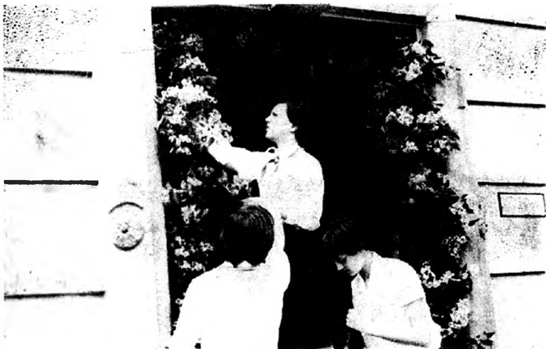
Várjuk a IV. éves hallgatókat, a holnap tanárait.