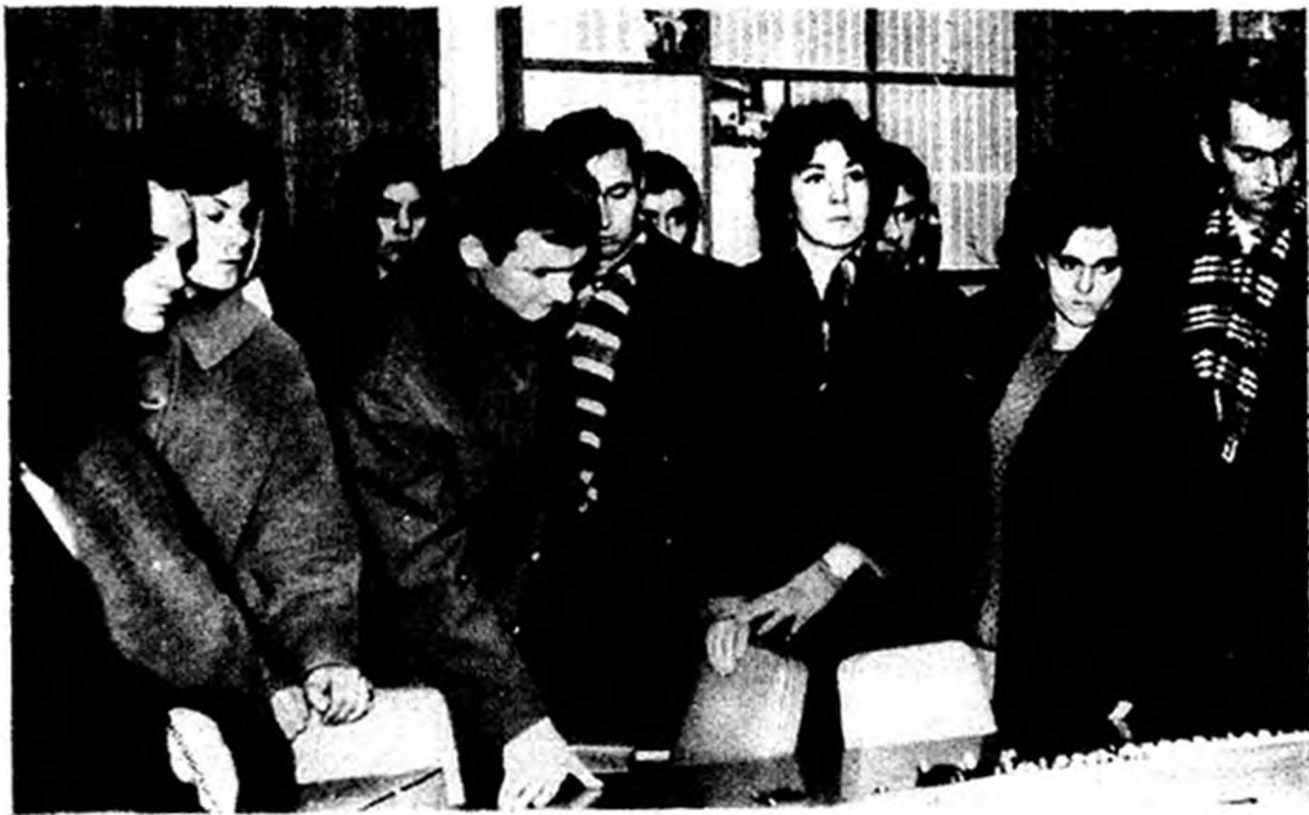
A filmszakkör tagjai a televízióval ismerkednek.

II. A filmezés, filmgyártás legfontosabb technikai kérdései: Hogyan készül a film? A film útja az ötlettől, a forgatókönyvtől a kivitelezésig és az előadásig. E részben szólnunk a vágásról, a világításról, az operatőr, a rendező munkájáról is. — Mint a szakkör tagjai érdeklődésének és aktivitásának