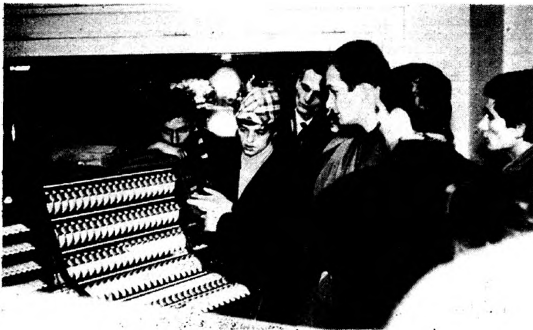
A szakkör tagjai a televízióban.

követelményeivel. — Ugyanebben a témakörben kap helyet néhány legjellegzetesebb irányzat jellemzése, mint pl. naturalizmus és szimbolizmus, — neo-realizmus és az ún. „Új Hullám”, valamint az egyes irányzatok sajátos népi-nemzeti megjelenítése.