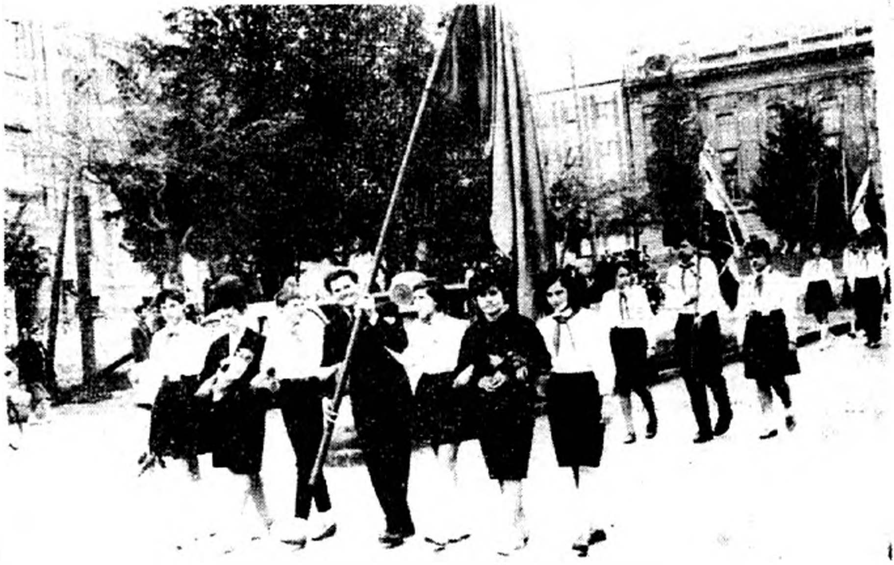
A IV. éves végzős hallgatók búcsúztatása.