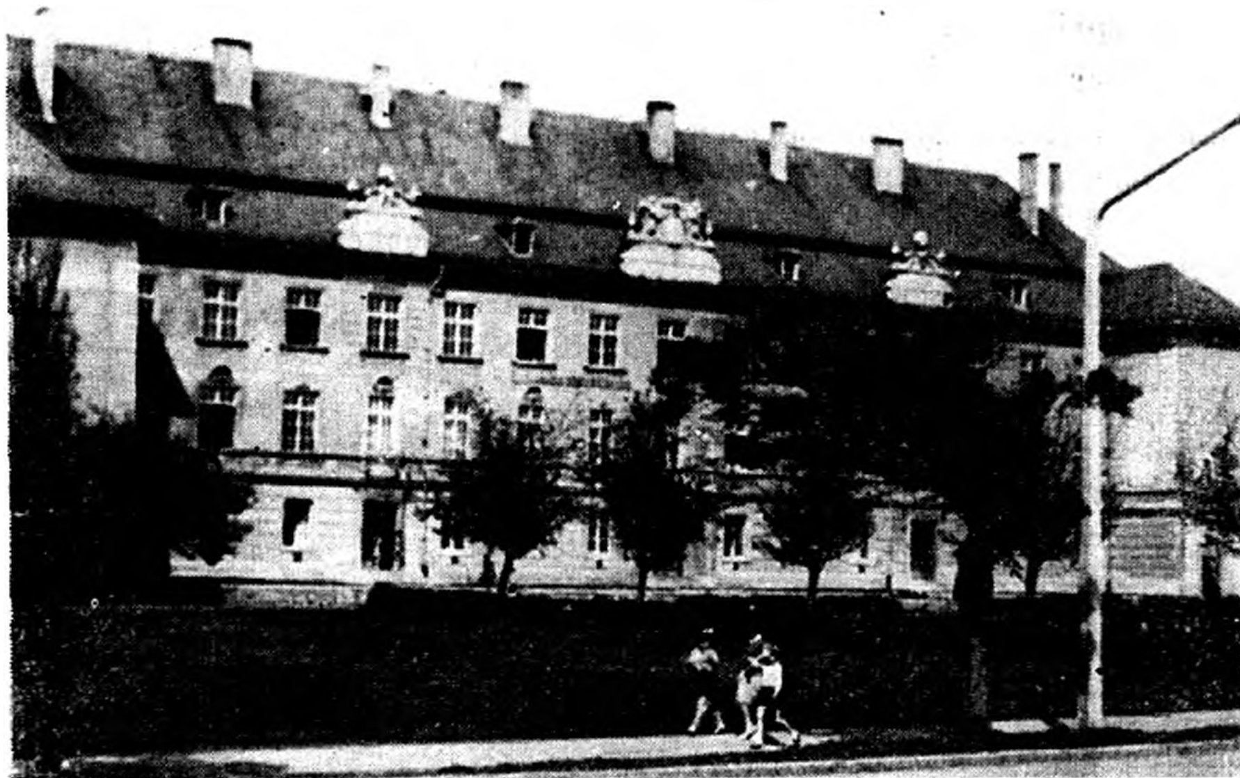
Az egri gyakorló iskola épülete.

Ez évben indult be a zenetagozatú I. osztály.