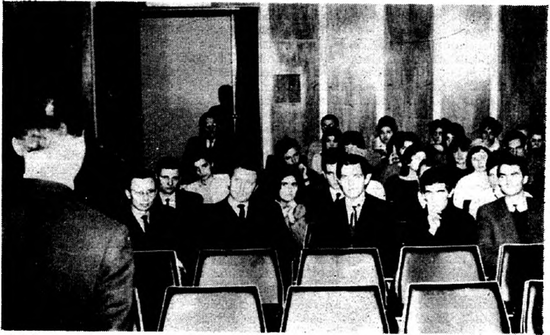
Az egyik tanulmányi kirándulás keretében előadást hallgatott a szakkör a budapesti Lengyel Kultúrában.