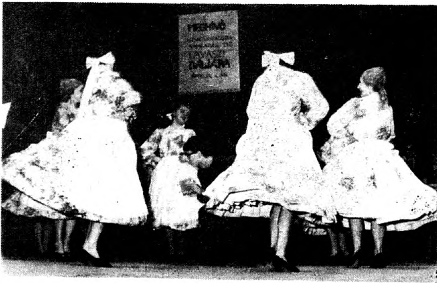
Az aranyérmes nyert táncsoport

Sajnálatos ugyan, de egyben az is jellemző, hogy a hozzánk érkező vendégeket csak úgy tudtuk elhelyezni, hogy főiskolásainknak el kellett utazniuk, bár nagyon sokan szerettek volna itt maradni a bemutatók megtekintésére.