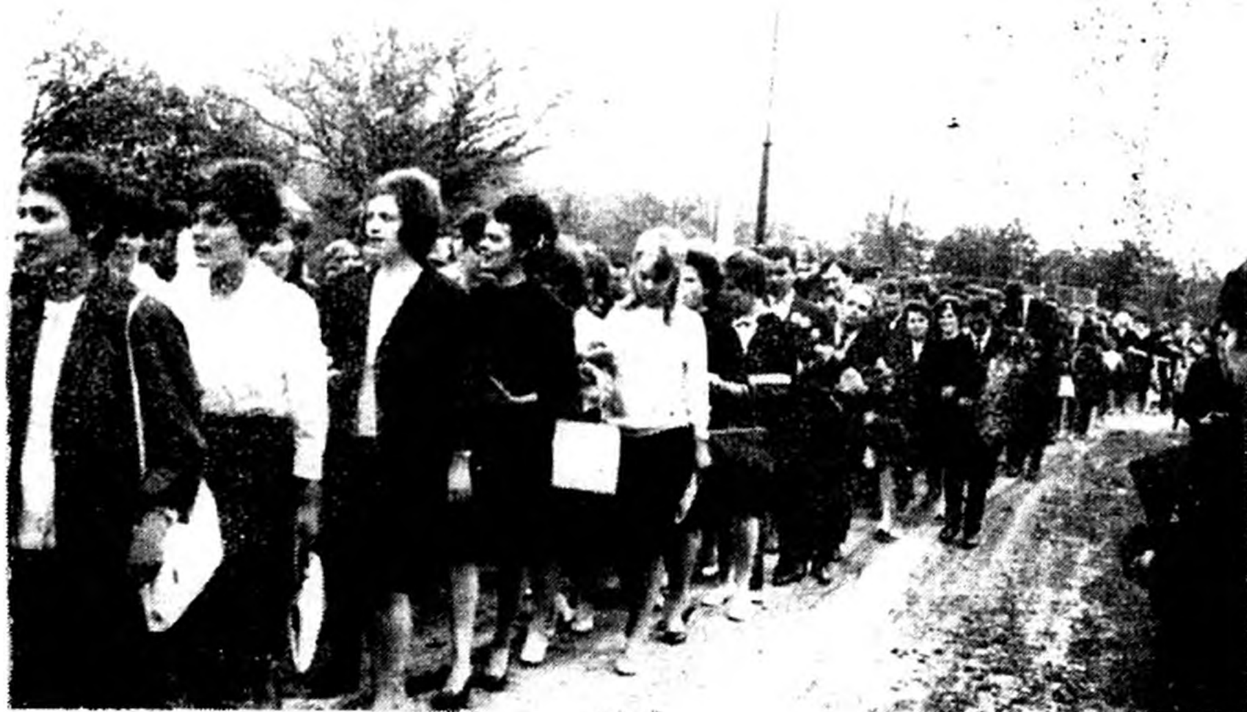
Megérkeznek iskolánkhoz a IV. évesek.

Hol és mikor eredt ez az út, hová és milyen magasra vezet, még nem tudjuk, biztosan, de abban bizonyosak lehetünk, hogy mindezideig előre vezetett, és ha a továbbiakban is megtartja irányát, valamikor a pálya végén fel-emelő és boldogító lesz visszatekinteni rá.