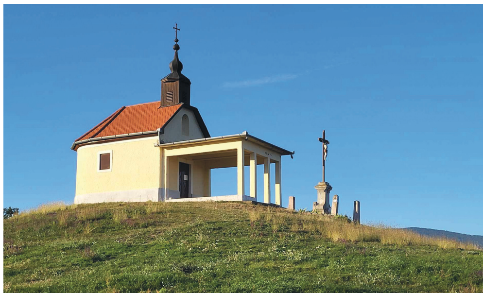
1. kép: A sár-hegyi Szent Anna-kápolna. 2013.

A szentek közül Szent Anna tiszteletére két búcsújáróhely is kialakult a 18. században a főegyházmegyében: a ma Dormándhoz tartozó Hanyi-pusztán található Szent Anna-kápolna és a Bélapátfalván a Gilitka-kápolna, 44 valamint a Sár-hegyen az Abasárhoz tartozó kápolna (3. ábra). A szentekhez kapcsolódó érdekesség, hogy 1773-ban XIV. Kelemen pápa ajándékként a monoki Andrassy-kastély kápolnájába került Szent Orbán vértanú ereklyéje a római Priscilla katakombából 45 (Soós 1985), azonban az ereklye nem vált búcsújáró helyé.