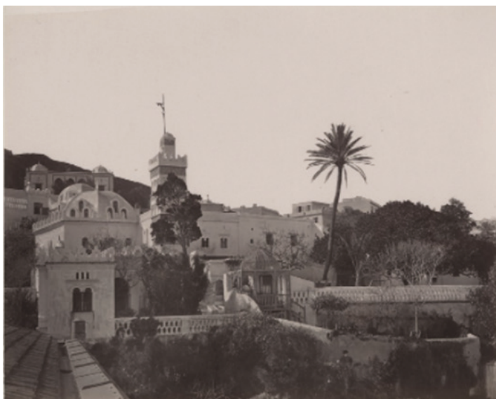
2. kép: Paul Maria Famin: Algérie (1880) 79

egy arab temetőt látogattam. A pénteki nap az arabok vasárnapja. Ez az egyetlen nap, melyen a tisztességes asszony mulat. A mulatás abból áll, hogy az asszonyok pereputtyos-tól fölkerelkednek és a temetőben a családi sírra telepszének. Itt ebédelnek s enyelegve töltik el a napot.” 78