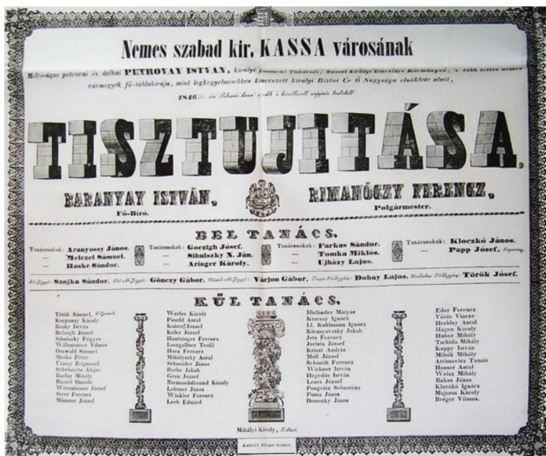
2. kép: Az 1846-os tisztújítás eredményének hirdetménye, 1846. AMK R/2 Mag., 1846/1131.