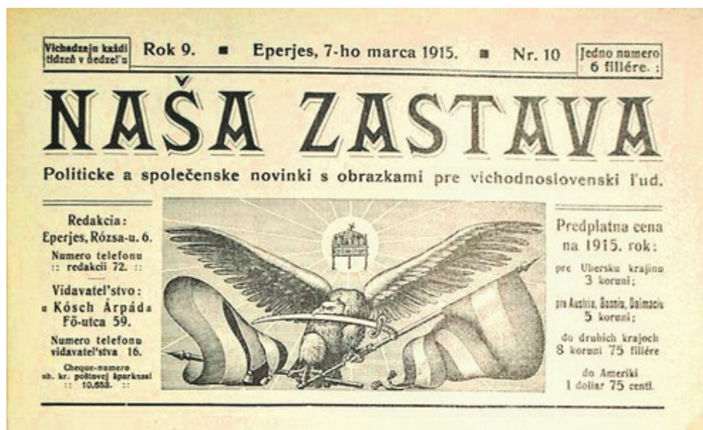
3. ábra: A Nasa Zastava címlapja