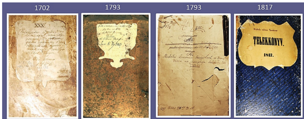
1. ábra: Miskolc telekkönyvei: Kötelkönyv/1702; Liber fundualis/1793; Quantumos/1793; Telekkönyv/1817

követelésének az ingatlanokra való betáblázásáról. 10 Ez a törvény ezzel nem egy általános, a hitelezők követelésének bejegyzését is tartalmazó telekkönyvről rendelkezik, sokkal inkább az adós ingatlanának helyszínén vezetett egyfajta zálogkönyvről. 11