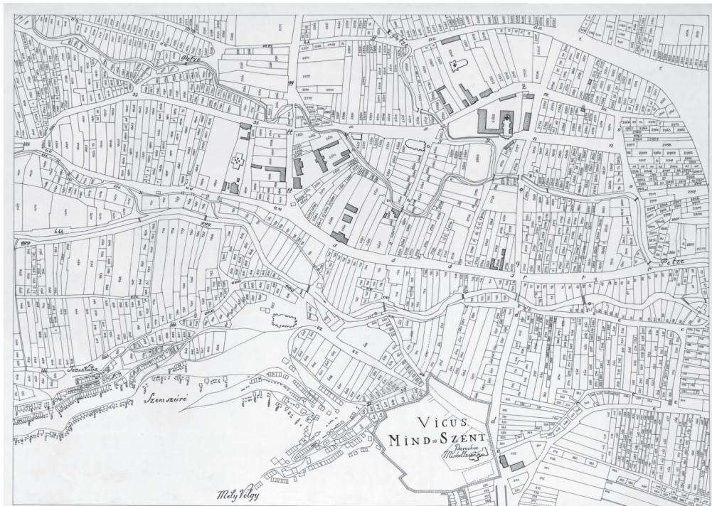
5. ábra: Miskolc 1817. telekkönyvi térképének részlete (A mezőváros beltelkei)