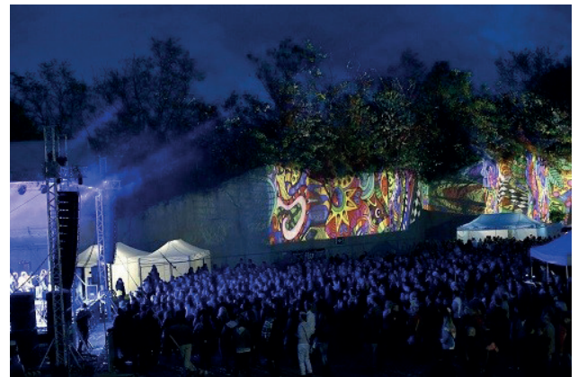
9.6. ábra. Szabadtéri rock koncert Egerben

Entertainment, culture. The town also offers entertainment for those favouring music programs and night clubs for dancing. Several discotheques are open for guests several days a week, often offering concerts (Figure 9.6.).