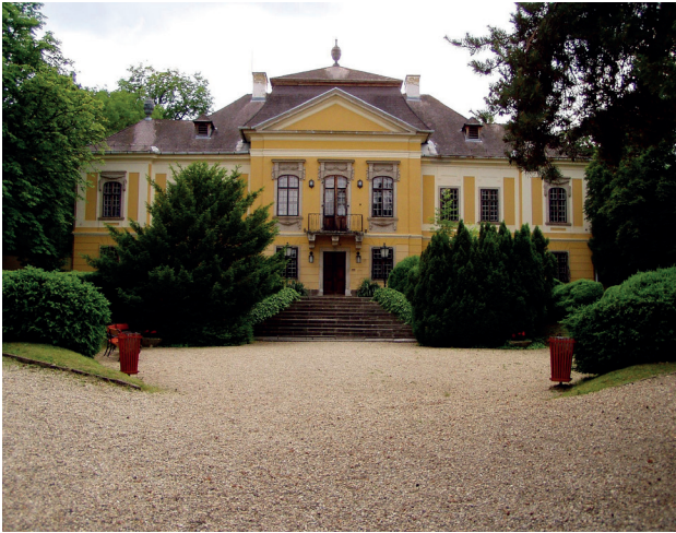
9.4 ábra. De la Motte kastély, Noszvaj