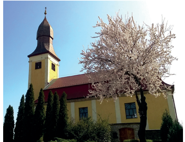
9.2. ábra. A műemlék védelem alatt álló noszvaji református templom

A kaptárkövek szintén a kőkultúra részét képezik, hiszen ezekbe a sziklavonulatokba vagy kúpalakú képződményekbe korábban élt emberek vájtak fülkéket, amelyeknek funkciója mind