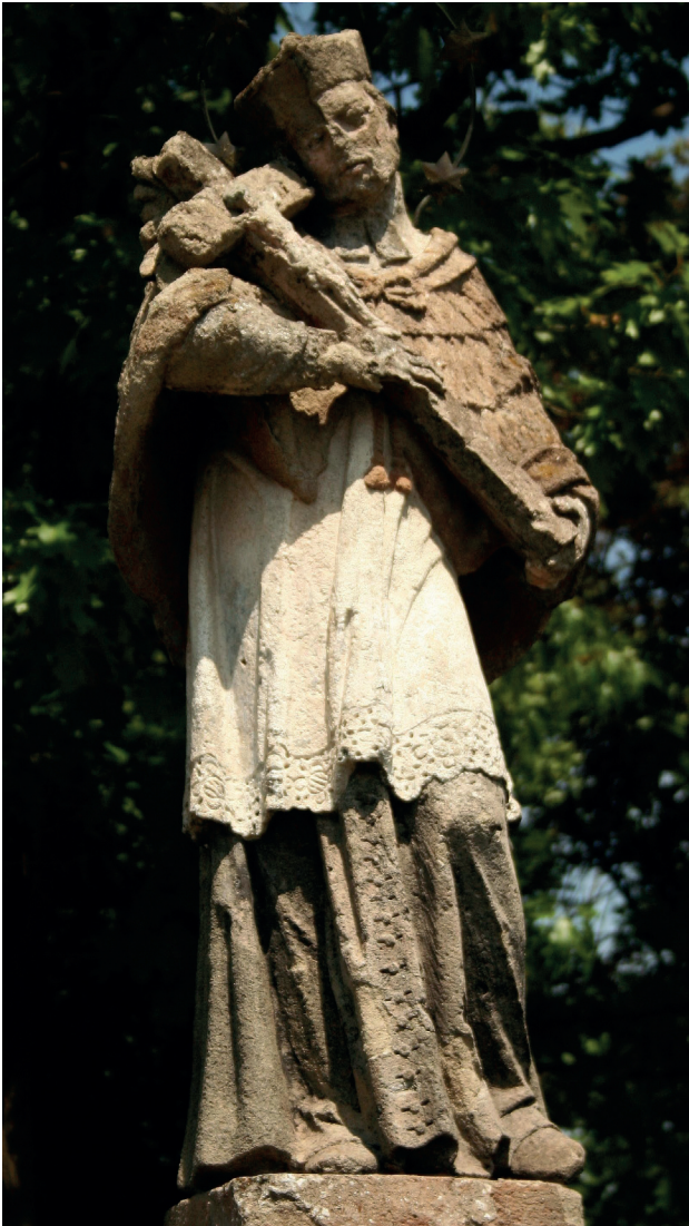
9.1. ábra. Az Egerszalókon található Nepomuki Szent János szobor

Figure 9.1. Statue of Saint John of Nepomuk, Egerszalók