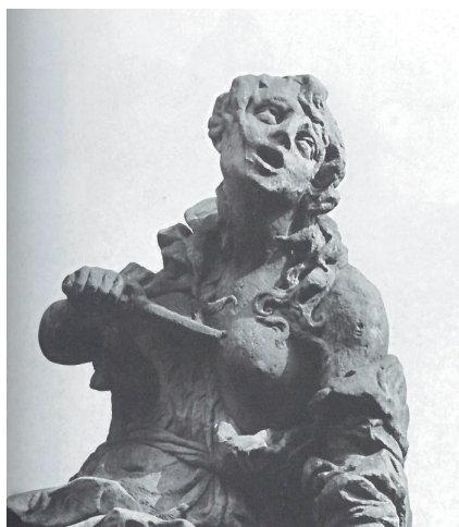
Mathias Braun Kétségbeesés c. szobra a „Bűnök” sorozatból (Kuksi kastélypark)

rendszeresen házi imádságra rendelte, ahol ő maga lépett fel a lelkipásztor szerepében, így akarván dacolni a hit elgyengülésével. 73