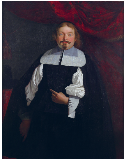
Humprecht Jan Černín gróf (Karel Škréta festménye)