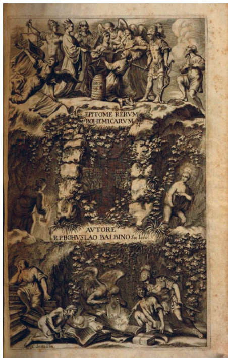
Karel Škréta allegorikus rajza az Epitome belső címlapján.

s amit a későbbi történetírás nem kis leegyszerűsítéssel az „elnemzetietlenedés” fogalmával írt körül (modern kifejezéssel jelölve meg az eltérő szerkezetű premodern jelenséget). Ezzel szembeszegülve az Epitome tulajdonképpen kísérlet a rendi patriotizmus barokk szellemiségű, katolikus átértelmezésére. Balbín áhítatosan tiszteleg a tősgyökeres cseh nemesség államjogi feladatvállalása előtt, s egyúttal a nemesség genealógiai leszármaztatását – meglehetősen problematikus módon – összekapcsolja a cseh szentek, s más, boldoggá avatott kegyes személyek családfájával, őket tekintve a történelmi folytonosság legfőbb letéteményesének. A Dissertatio lapjain viszont egyre inkább etnikai alapra helyezkedik: gyűlölettel beszél a betelepült újbirtokos