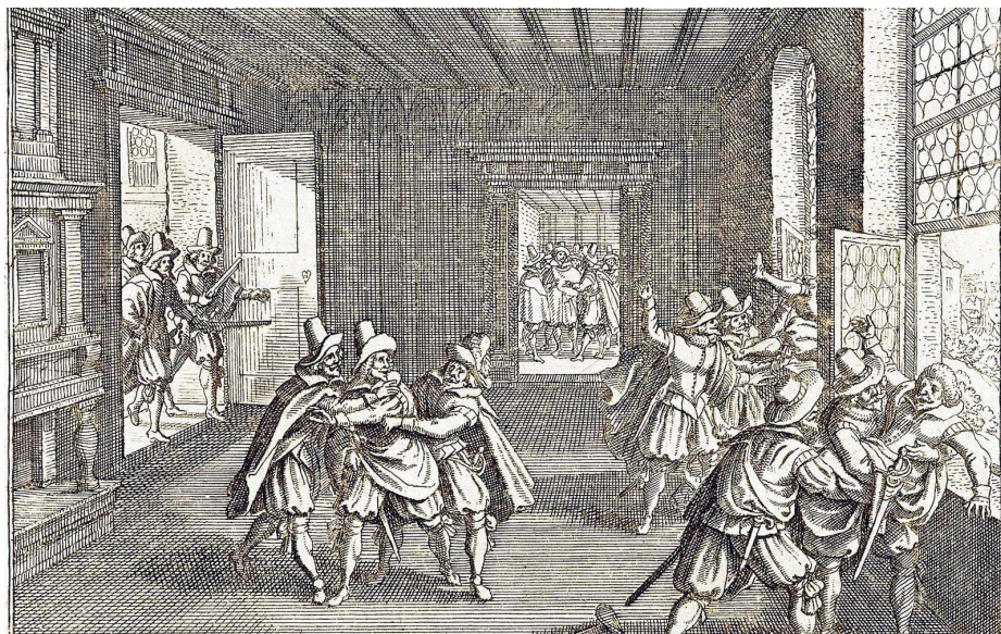
Prágai defeneztráció, 1618 (korabeli ábrázolás)

Az 1627-ben kiadott Megújított Országos Rendtartás – az új alkotmány – megőrizte ugyan a Cseh Korona államjogi különállását, de megfosztotta a cseh (s egy évvel később a morva) tartománygyűlést korábbi jogai többségétől. Kizárólag a katolikus vallást engedélyezték. Az áttérést megtagadó protestánsok – köztük Comenius és követői – távozni kényszerültek az országból. A lázadók birtokait felosztották az udvarhű katolikus párt hívei között. Wallenstein (csehül Valdštejn) különutas kísérletének bukásával (1634) a meggyilkolt fővezér egykori birtokait az ellene forduló főtisztek kaparintották meg. Az emigránsok utolsó visszatérési kísérletét (1648) jelképes módon már maguk a prágaiak akadályozzák meg, amikor a Károly-hídon feltartóztatják a várost megrohanó svéd katonaságot.