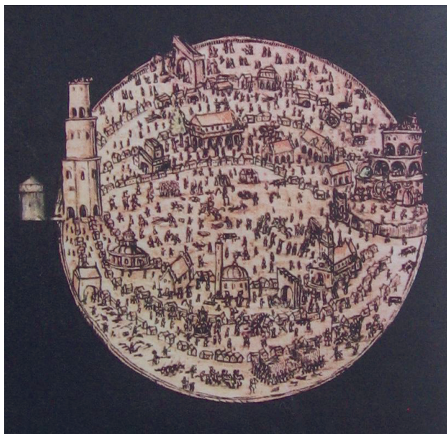
A város-világ rajza Comenius A világ útvesztője és a szív paradicsoma kéziratából

s mint ilyenek, a reneszánsz humanizmusra kétes érzésekkel tekintenek (iszonyodva a lélek megváltását veszélyeztető pogány csábítástól). 49 S Comeniusban, fejtegeti Šalda, rettenetes erővel dolgozik a barokk korra jellemző belső meghasonlás: egyfelől aszkétikus középkori alak, a reneszánsz tudományok ellenlábasa, aki istenes vidéki emberként Isten bizonyosságában keresi tartós nyugalmát, másfelől azonban nemzetekfeletti, egyetemes szellem, a pánszófia tudományának hirdetője, az emberiség lelkiismerete. Az emigrációban kiadott allegorikus barokk regénye, A világ útvesztője és a szív paradicsoma a korszak legjelentősebb irodalmi teljesítménye (ami egyúttal cseh kontextusban is elkerülhetetlenné teszi a „protestáns barokk” fogalmának bevezetését).