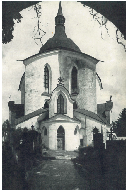
A gótikus barokk Žďár nad Sazavou-i templom

Később arra is hivatkozott, hogy a barokk időszak szentbeszédeiben felfedezhető a gótikus (huszita) korszak prédikációs hagyománya (például a „hegyek” motívuma, „ahonnét Isten jobban megismerhető”). 71 Ezek az összefüggések azonban már nagyon áttételesek. Az irodalom ugyanis eltérő pályán fejlődött, mint a nemzetközi hírű cseh barokk építészet és képzőművészet. Bármennyire is rokon a középkori és barokk szövegek biblikus háttere, a prédikációk narratív elemei és morális üzenete annak a barokk kornak a terméke, amely a középkorhoz képest sokkal mélyebben érzékelt a népi mentalitást. Különösen jól megfigyelhető ez a népi olvasmányok terén, melyek kifejezetten széles kört szólítottak meg. 72