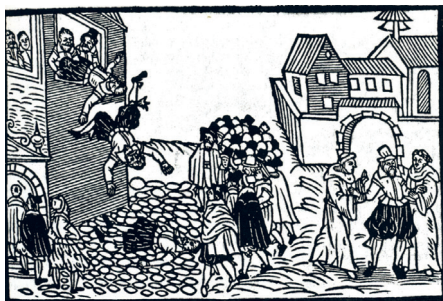
Prágai defenzstráció, korabeli rajz a prágai Wahrhaftige Zeitung c. újságban