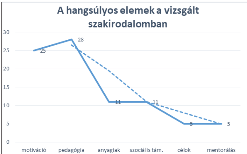
1. sz. diagram

13. Meglátásunk szerint a lemorzsolódás egyfajta felsőoktatásból való kiábrándulás is, ami arra utal, hogy nem azt kapja az érdeklődő, mint amit az egyetemi képzéstől várna, tehát a szolgáltatás színvonala és módja nem egyezik az egyén általi elképzelésekkel, melyet néhány kutatás eredménye is alátámaszt. (Ceglédi, 2019; Józsa, 2019; Szöllősi, 2019) Ez ugyan a rendészeti cikkek vonatkozásában nem jelenik meg konkrétan, azonban összefüggések formájában felfedezhető.