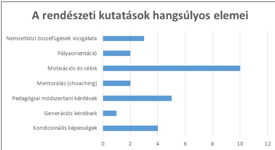
4. sz. diagram

Maga a lemorzsolódás megítélése is megosztja a kutatókat és oktatókat, hiszen vannak, akik úgy ítélik meg, hogy egyértelműen rossz, vannak, akik pedig egy szükséges és kívánatos folyamat, a kiválasztás részeként tekintenek a témára. A gyakorlat próbájaként kezelik az intézmény elhagyását. (Márton, 2018; Miskolci, Bárány, Király, 2016) A tanárok véleménye is megosztja ezen a téren, hasonlóságot tapasztaltunk, amit egy korábban rögzített interjú vizsgálat kapcsán rögzítettünk.