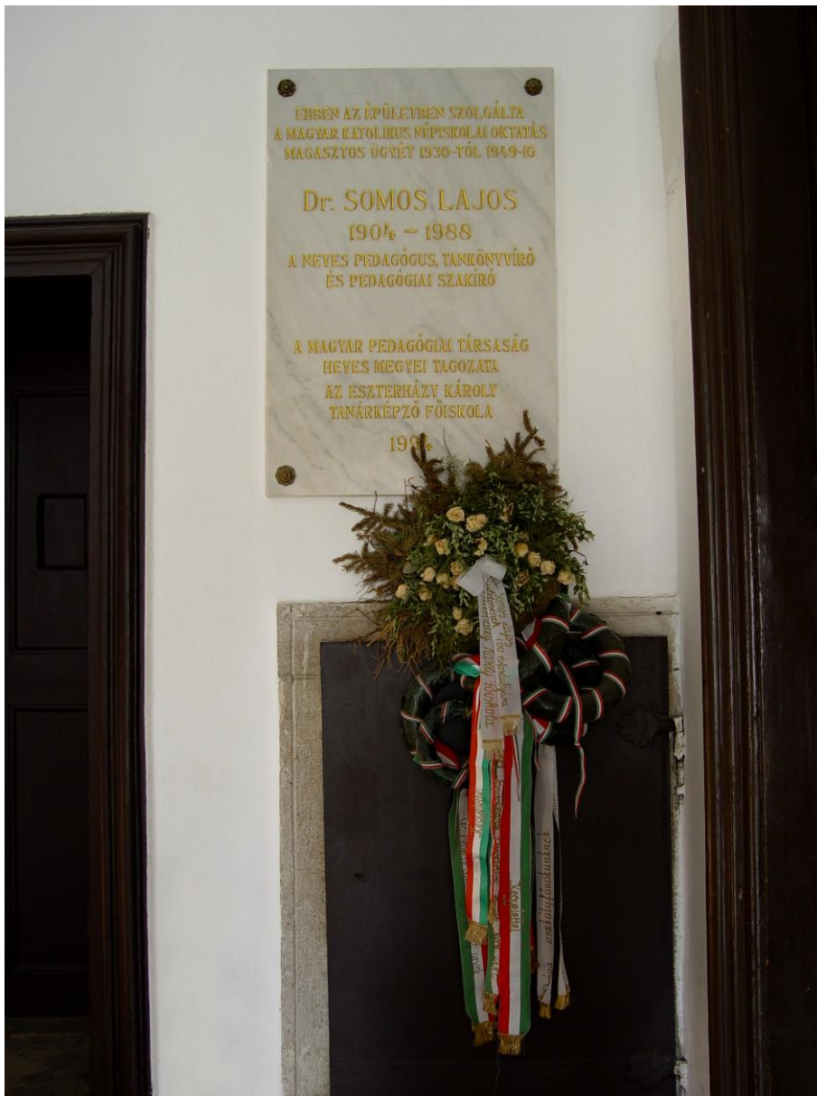
Dr. Somos Lajos emlékműzeum (VI. emelet)