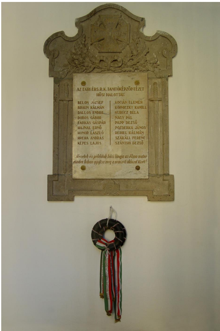
Az I. világháború hősi halottai (I. emelet)