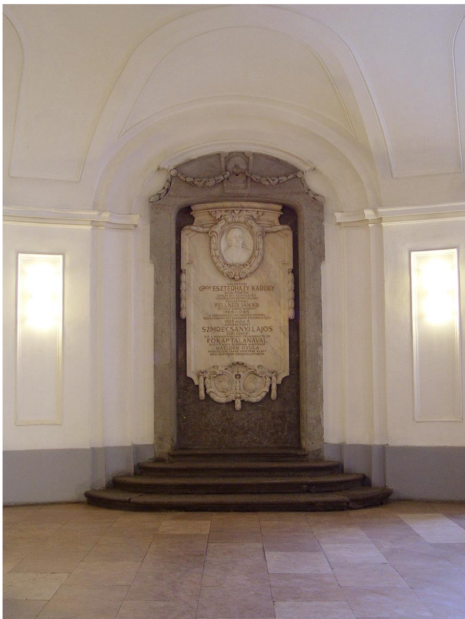
A líceum építtetője: Eszterházy Károly püspök emléktáblája