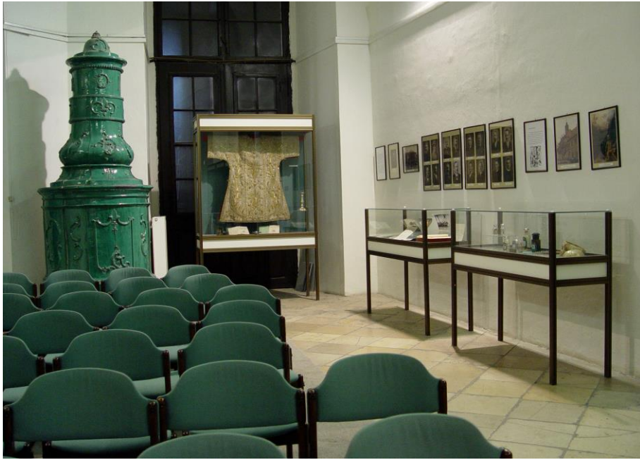
A múzeum belső tere a bejárat felől nézve