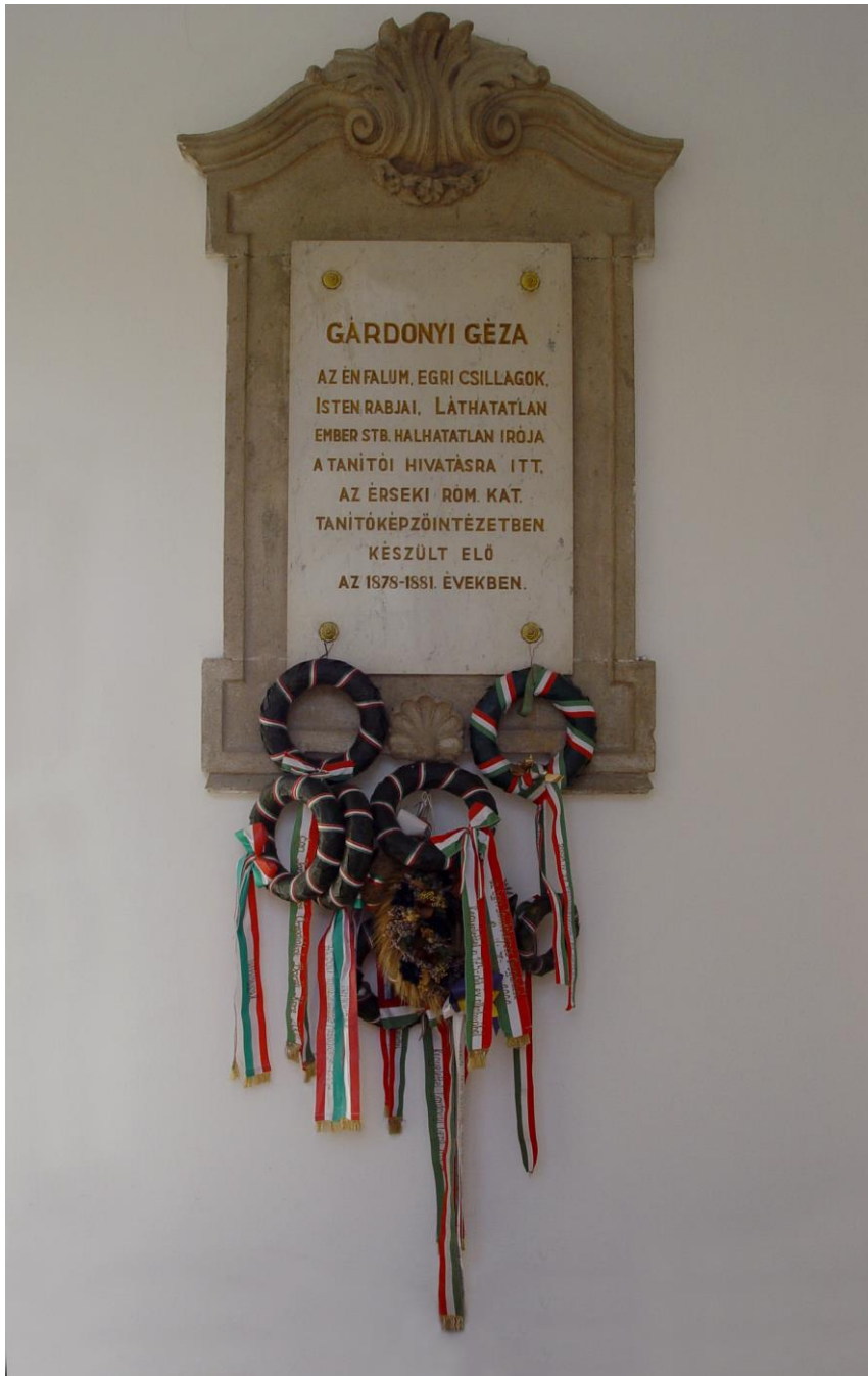
Gárdonyi Géza író emléktáblája (I. emelet)