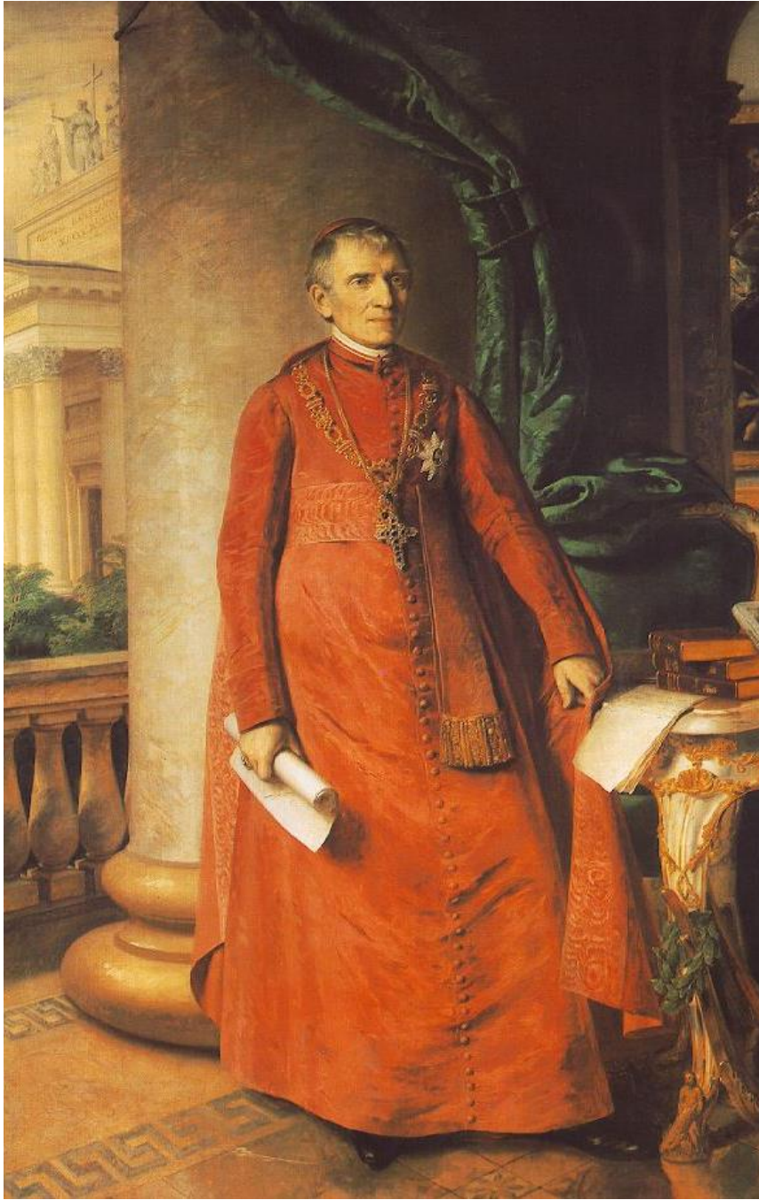
Az első magyar tanítóképző megalapítója Pyrker János László egri érsek (Barabás Miklós festménye)