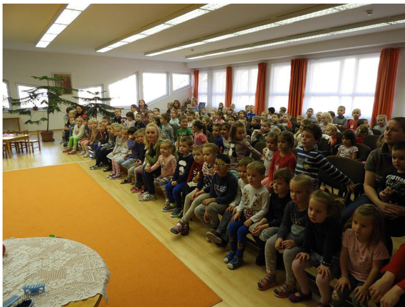
6. kép: Az óvodai közönség a sárospataki Carolina Óvoda és Bölcsődében