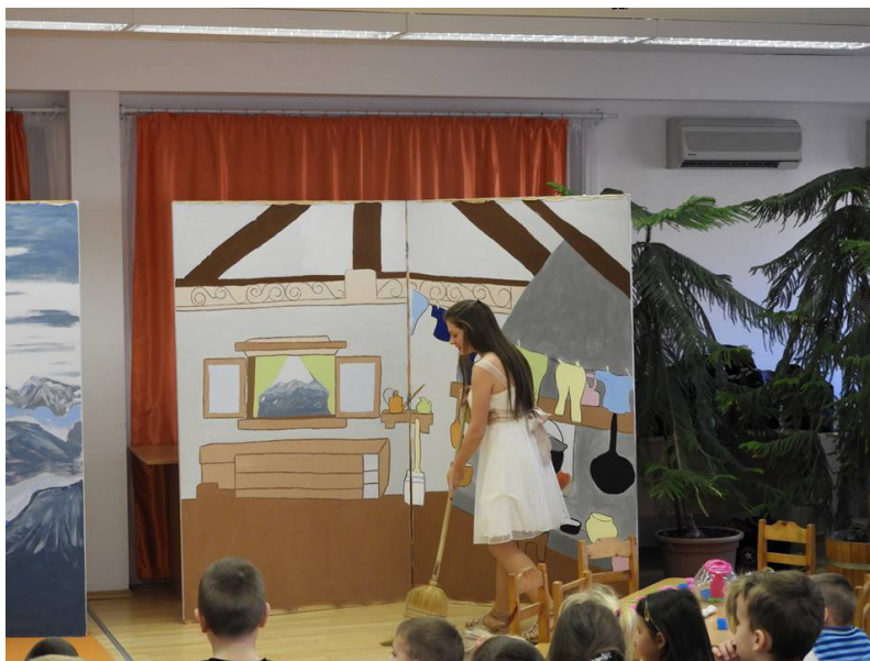
8. kép: Hófehérke a hét törpe otthonában serénykedik