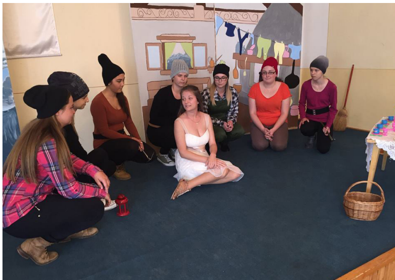
4. kép: Hófehérke a hét törpe társaságában