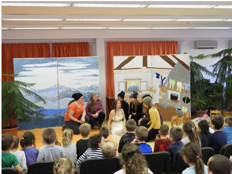
9. kép: Hófehérke és a hét törpe a maguk festette díszlet és az óvodai szobafenyők környezetében