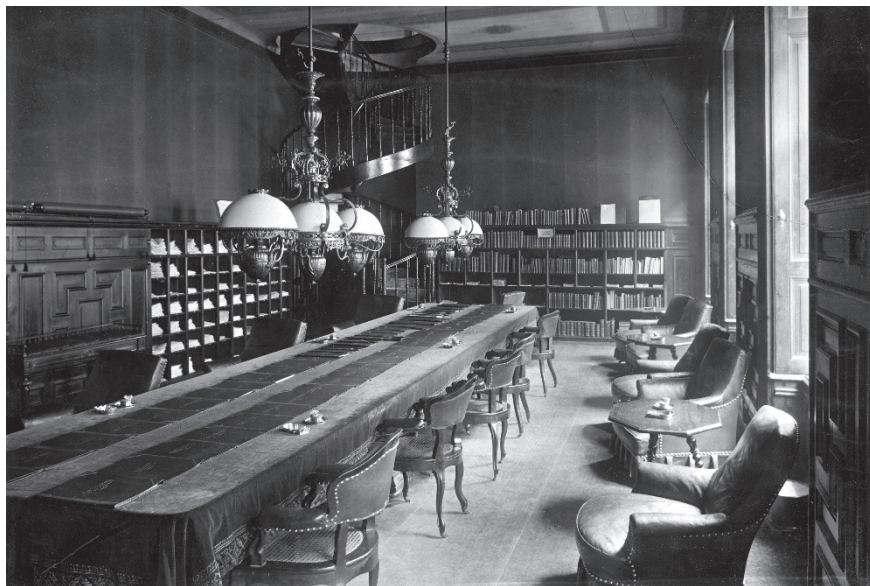
2. kép A könyvtár olvasóterme 19