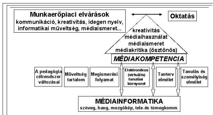
1. ábra: A médiakompetencia kapcsolatrendszere

A fenti gondolatmenetet értékelve egyet tudunk érteni a szerző intelligens médiafogyasztásra, illetve tudatos médiahasználatra történő nevelési elveivel, valamint a tanárképzés ez irányú feladataival. Valljuk, hogy a feladatok megoldásában – mely a médiakompetencia kialakítását jelenti – jelentős szerepet játszik majd a közoktatásban jól kialakított (a kor elvárásainak megfelelő), médiaismerettel kibővített informatikai ismeretanyag elsajátítása.