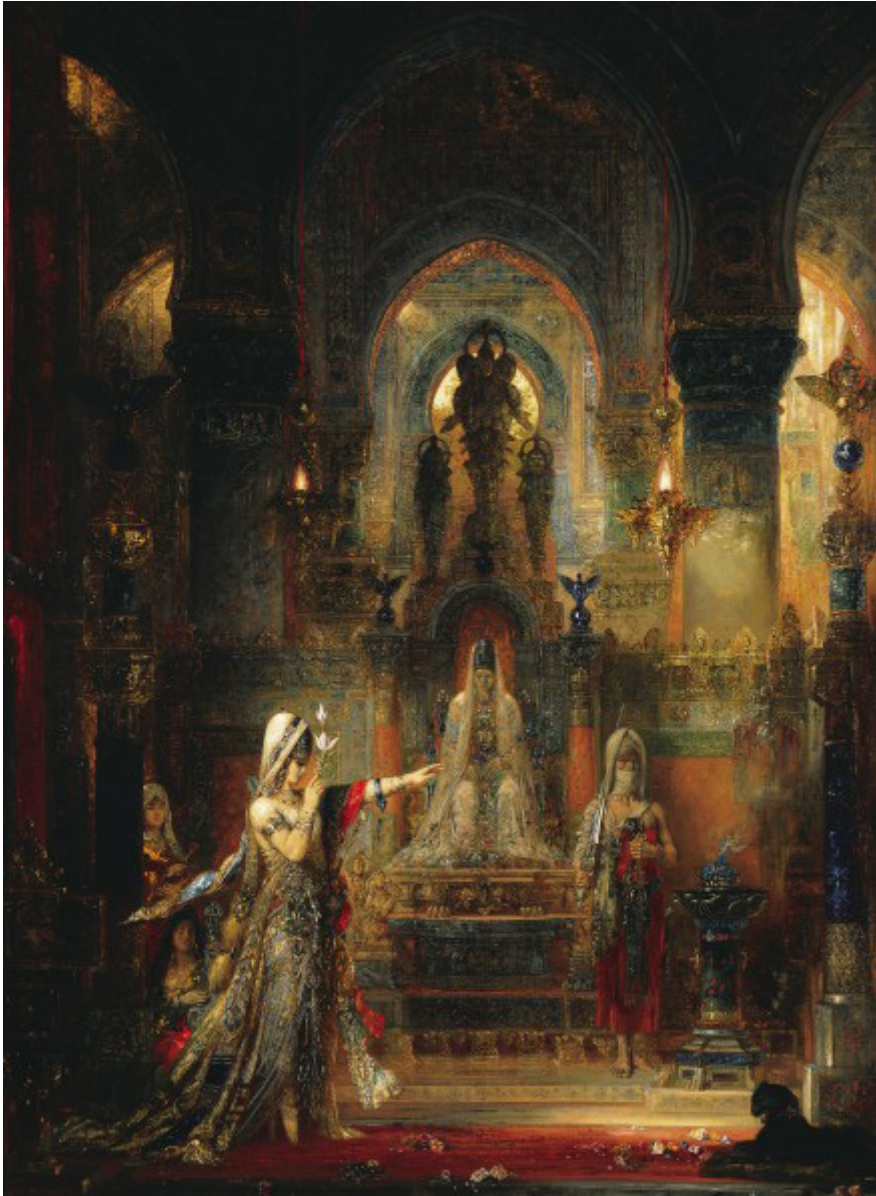
Gustave Moreau: Salome táncol Heródes előtt , 1876. Olaj, 143.5 x 104.3 cm Hammer Museum, Los Angeles