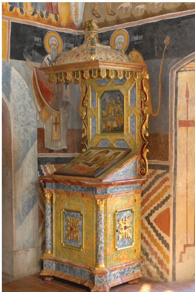
6. kép: Baldachinos ikontartó szekrény (Keresztelő Szent János-kápolna, keleti fal)