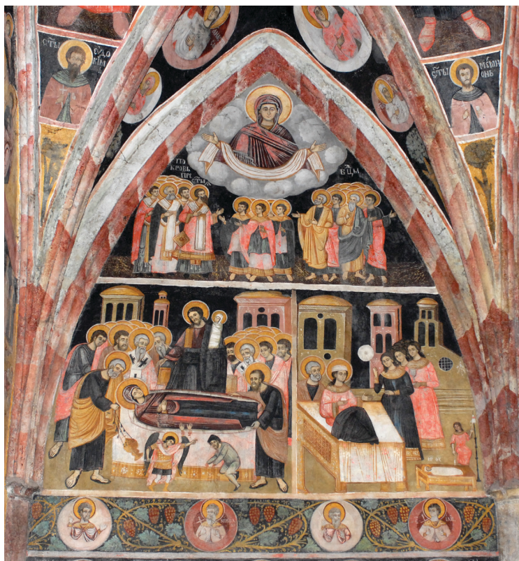
7. kép: Az Istenanya életét bemutató szekciók a pronaoszbán (északi fal)