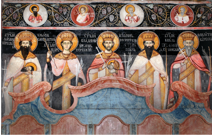
11. kép Szent Lázár, Szent Uroš, Szent Jovan Vladimir, Dečani Szent István, Szent Milutin (naosz, északi oldal)