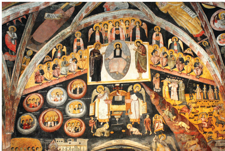
9. kép: Az utolsó ítélet (pronaosz, nyugati fal)