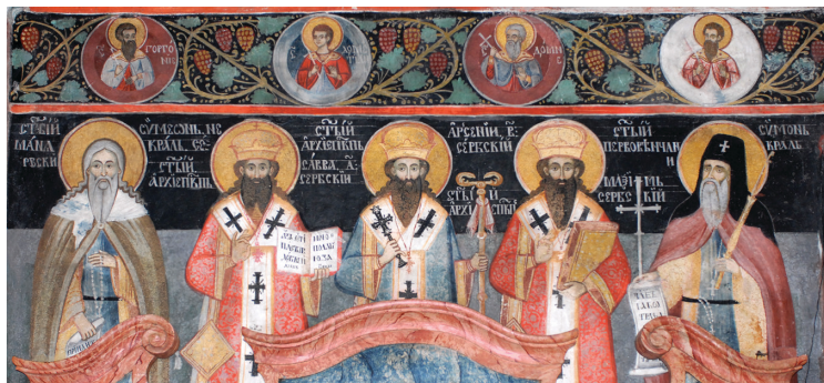
10. kép Szent Szimeon, Szent Száva, Szent Arzén, Szent Makszim, Szent Szimón (naosz, déli oldal)