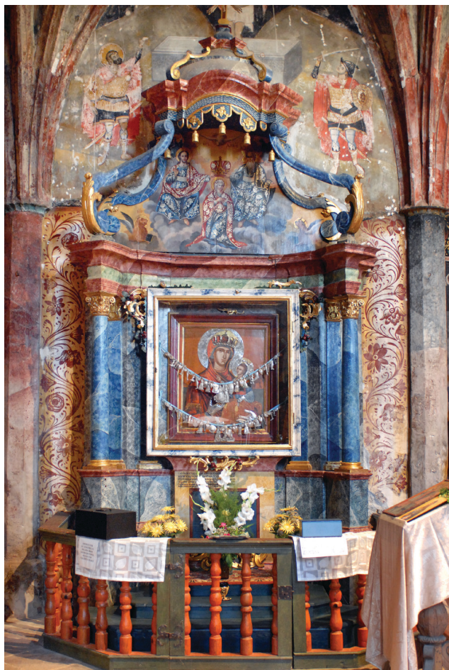
5. kép: Az Istennanya-trónus (naosz, északi oldal)