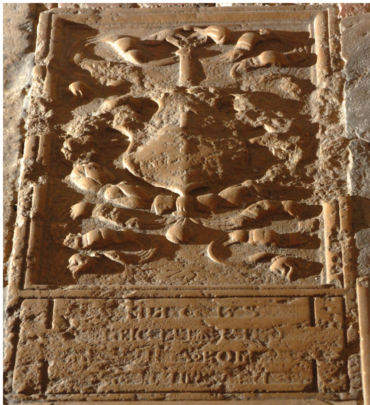
12. kép Reneszánsz sírlap (pronaosz)