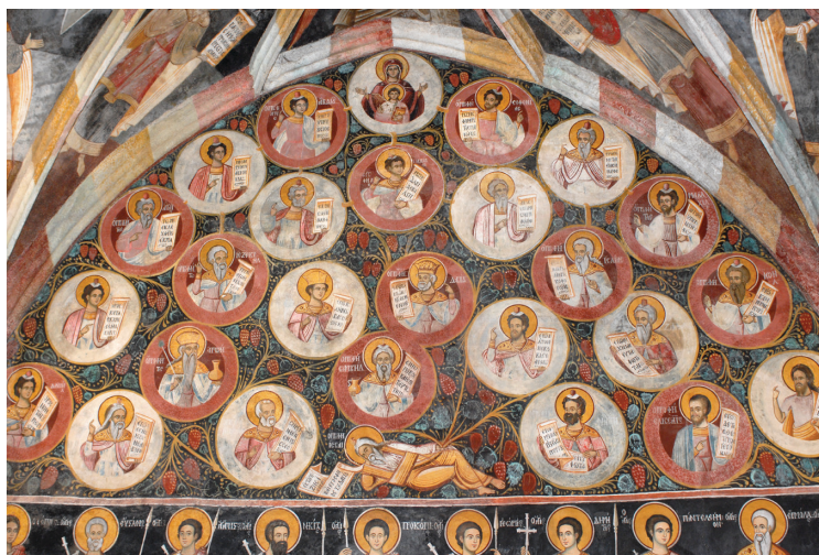
8. kép: A Jессze-fa ábrázolása (Keresztelő Szent János-kápolna, nyugati fal)