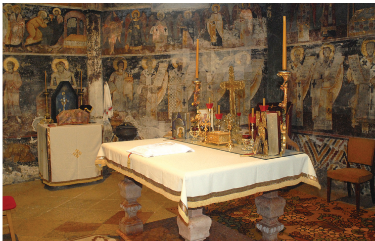
3. kép: A szentély belseje