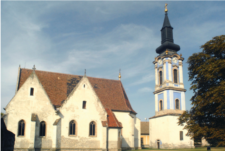
1. kép: A ráckevei Istenanya Elszenderedése szerb ortodox templom