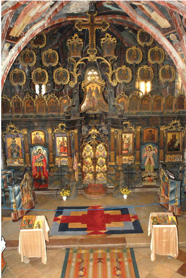
4. kép: Az ikonosztázion