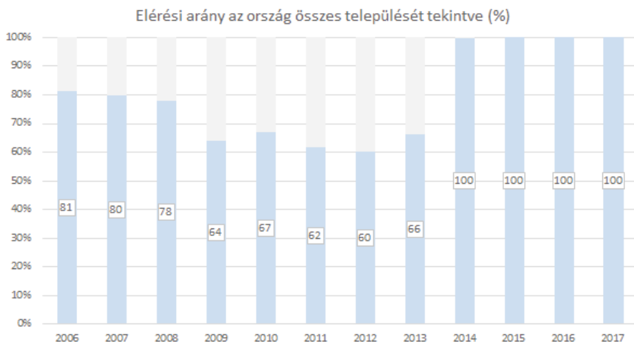
2. sz. ábra. Forrás: Kulturális Statisztika 2006–2017

A szervezetek típus szerinti besorolása alapján 2017-ben a közművelődési feladatellátást végzők több mint fele (57%) közösségi szintér, illetve valamilyen közművelődési intézmény formájában valósították meg a tevékenységüket, a fennmaradó részben (43%) pedig egyéb szervezettípusok (egyesület, alapítvány, közalapítvány, gazdasági társaság, egyéni vállalkozás) tevékenysége által. A 20/2018. (VII. 9.) EMMI rendelet a közművelődési alapszolgáltatások, valamint a közművelődési intézmények és a közösségi szinterek követelményeiről – mint címe is mutatja – a fenti feladatellátók közül kizárólag a közművelődési intézményeket, illetve a közösségi szintert vonta hatálya alá. Ezek esetében azonban részletes tárgyi, infrastrukturális és személyi elvárásrendszert teremtett a minőségi szolgáltatás nyújtása érdekében.