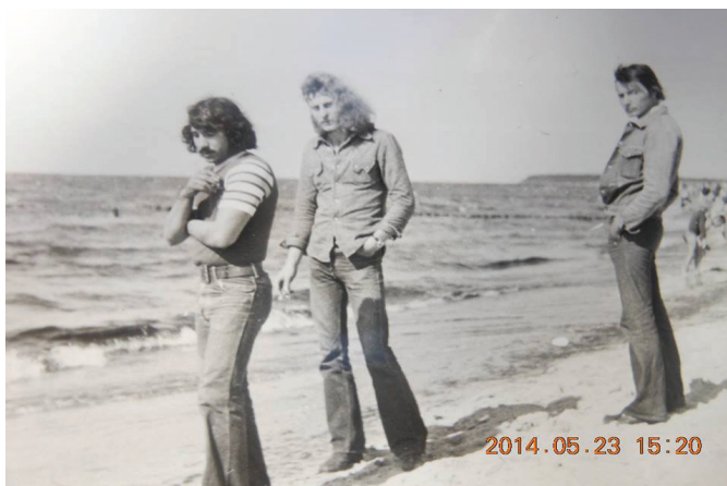
Magyar fiatalok a tengerél