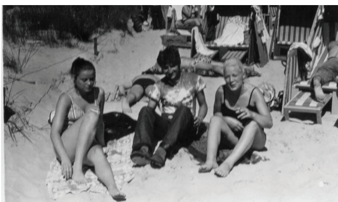
Magyar fiatalok német lányokkal