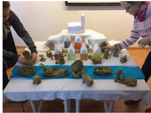
II/7-8. kép: A Sárospataki II. Rákóczi Ferenc Általános Iskola 4. osztályosai hallgatók segítségével Szabó Vladimír Téli város című képnek téri rekonstrukcióját végzik. Előzőleg a gyerekek agyagból elkészítették a festményen szereplő tárgyakat, figurákat. (Tanár, fotók: Lenkey-Tóth Péter)