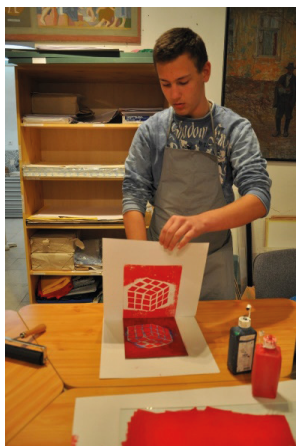
II/12. kép: Egy Rákóczi iskolai tanuló Domján József fametszeteinek tanulmányozása után papírmetszetet készít a Képtárban (Leitnerné Csete Andrea programja)