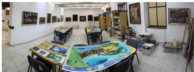
II/11. kép: A Sárospataki Képtár múzeumpedagógiai terme