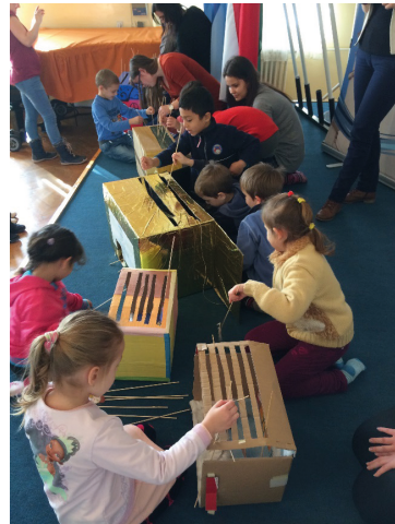
II/9-10. kép: A sárospataki Carolina Óvoda és Bölcsőde óvodásai önfeledten báboznak a hallgatók által készített dobozszínházakkal. (Tanár, fotók: Lenkey-Tóth Péter)