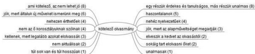
3. ábra: A tanulók véleménye a kötelező olvasmányokról (2012)

A kötelező olvasmányokról 2012-ben sem formáltak kedvezőbb véleményt a megkérdezettek, ahogyan a 3. ábrán megjelenített kategóriák is mutatják. A strukturált interjúk keretében azért voltak a kötelezők mellett érvelők is, akik azt emelték ki, hogy az iskolában feladott művek révén olyan témákkal ismerkedhetnek meg, melyekkel egyébként biztosan nem találkoztak volna. Mellettük szól az is, hogy azok, akik szabad idejükben egyáltalán nem vesznek könyvet a kezükbe, legalább a kötelezőket kénytelenek elolvasni. Mások azért tartják fontosnak őket, mert ismeretük hozzátartozik az alpműveltséghez, és mert sok klasszikus, értékes olvasmány található köztük. A megkérdezettek többségének (beleértve a kedvtelésből rendszeresen olvasókat is) véleménye azonban inkább elmarasztaló a kötelező olvasmányokat illetően. Érveik között gyakran szerepelt, hogy egy olyan művet, amelynek elolvasására kötelezik őket, kevésbé szívesen olvasnak, mint az olyat, amelyet maguk választhatnak meg. A negatívumaik közé tartozik még az unalmas vagy érdektelen téma, a nehezen érthető cselekmény, mely sokszor a régies, nehézkes nyelvezetnek köszönhető, hogy nem aktuálisak, nem tartalmaznak hasznosítható ismereteket a jelen kor emberének, nem az ő korosztályuknak íródtak, nem olyan problémákat vetnek fel, amelyek őket érintik és érdekelhetik, hosszúak, és akár el is vehetik a kedvet az olvasástól.