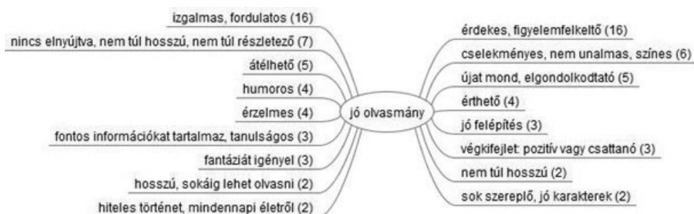
1. ábra: A jó olvasmány motívumai (2012)

Arra a kérdésre, hogy mit olvasnak szívesen, egy mondattal a következőképpen lehetne válaszolni: mindent, ami elrugaszkodik a realitástól, a valós történeteket, dokumentumszövegeket nem preferálják. Kedvenc olvasmányaik a következő műfajokból és témákból kerülnek ki: vámpíros, megfoghatatlan, fantáziavilág, fantasy, thriller, horror, szerelmes regény, lányregény, romantikus, sci-fi, misztikus, anime, manga, kalandregény, mondanivalóval bíró történetek. A 2012-es strukturált interjúk eredményeivel összehasonlítva a mostani válaszokat, arra a következtetésre juthatunk, hogy a kedvelt olvasmányok fő motívumai nem változtak az elmúlt öt évben. 2012-ben az izgalmas, fordulatos, pörgős, haladós cselekményvezetés, a nem túl hosszadalmas, részletező kifejtés nagyon sok válaszban szerepelt. Fontos, hogy maga a téma érdekes legyen, semmiképp sem unalmas, felkeltse az olvasó figyelmét, érdekeltté tegye az olvasásban. A lányok inkább emelték ki az érzelmes jelleg fontosságát, míg a fiúknál fontos a felépítés, a kidolgozottság. Néhányuknál az elgondolkodtató, a tanulságos, a hiteles vagy az újat mondó szövegek élveznek előnyt, míg másoknál a fantázia, a humor vagy a titokzatosság a kedvelt motívum. Azok, akik sokat olvasnak kedvtelésből, szeretik, ha egy olvasmány hosszú, és sokáig tart elolvasni, míg a kevesebbet olvasók inkább annak örülnek, ha rövidebb a szöveg (l. 1. ábra) (Magyarné, 2013).