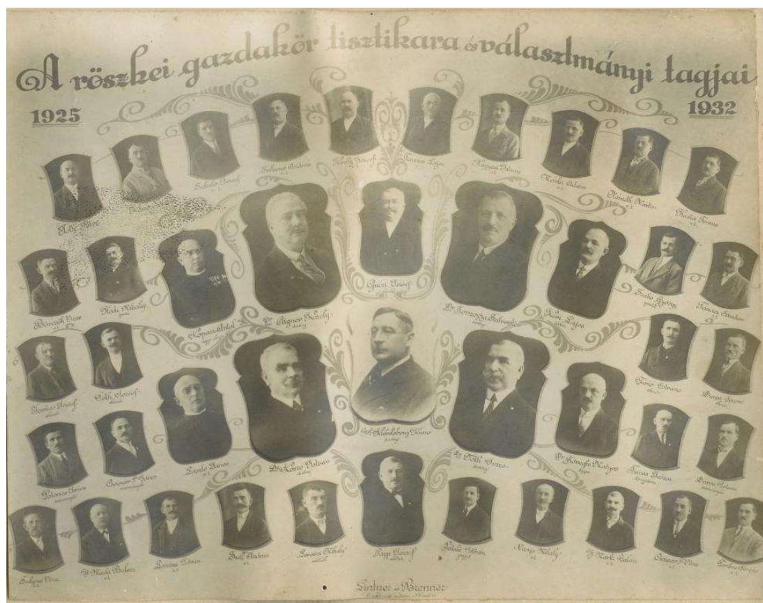
1. kép. A röszei gazdakör tisztikara és választmányi tagjai (1925–1932) A gazdakör dísztagja Gróf Klebelsberg Kuno volt.

A Szeged-Alsótanya Átokháza és Vidéke Gazdakör 1923-ban alakult. Az egyesületet a csorvai és felsőátokházi gazdák alapították. Rendezvényeiket a honvéderdei iskolában tartották. A kör tevékenységében jelentős szerepet vállaltak a tanítók. A kör vezető szerepet játszott a környék úthálózatának fejlesztése ügyében. 1935-ben csatlakoztak a környék gazdaköreinek a földbérleti szerződések revíziójára irányuló mozgalmához. 12