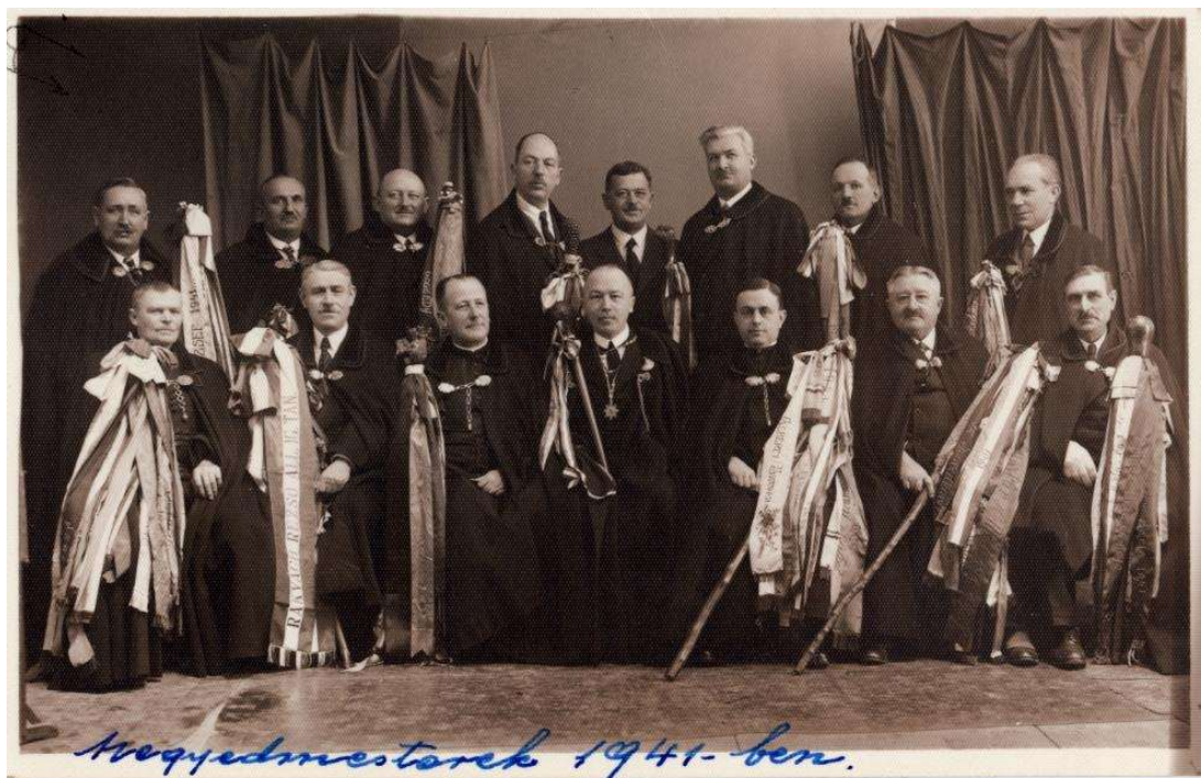
Fertálymesterek csoportképe 1941-ben. MNL HML V-72/b. 10. d.

város által előírt feladatok nélkül, tisztos társadalmi tevékenységként negyedeik szószólói voltak, segítették a szegényeket, gondot viseltek a helyi kulturális értékekre. A fertálymesterség presztízse ekkor érte el a csúcspontját, hiszen magas rangú főpapok, országgyűlési képviselők, megyei és városi vezető tisztviselők is megtiszteltetésnek vették, ha fertálymesterek lehettek. A 18-19. században nem volt egységes fertálymesteri testület, hanem az egyes negyedek szerint 12 elkülönülő csoport létezett, amelyhez a még élő összes fertálymester tartozott. Ilyen keretek között választották meg évente az új negyedmestereket, tartották meg az összejöveteleket és vezették a fertálymesteri naplókat. Az összes fertálymester évente csak egy alkalommal, Szent Apollónia napján (február 9.) jött össze, amikor a jellegzetes százcáncú köpenyben és a szalagos fertálymesteri bottal részt vettek a bazilikában tartott szentmisén, és a városházán letették az esküt. Az egységes fertálymesteri közösség Egri Negyedmesteri Testület néven 1931-ben alakult meg, és fogta össze az egyes negyedek képviselőit, működött megválasztott tiszttal és a fertálymesterek tízparancsolatában megfogalmazott elvek, célkitűzések szerint. 2 (1. kép)