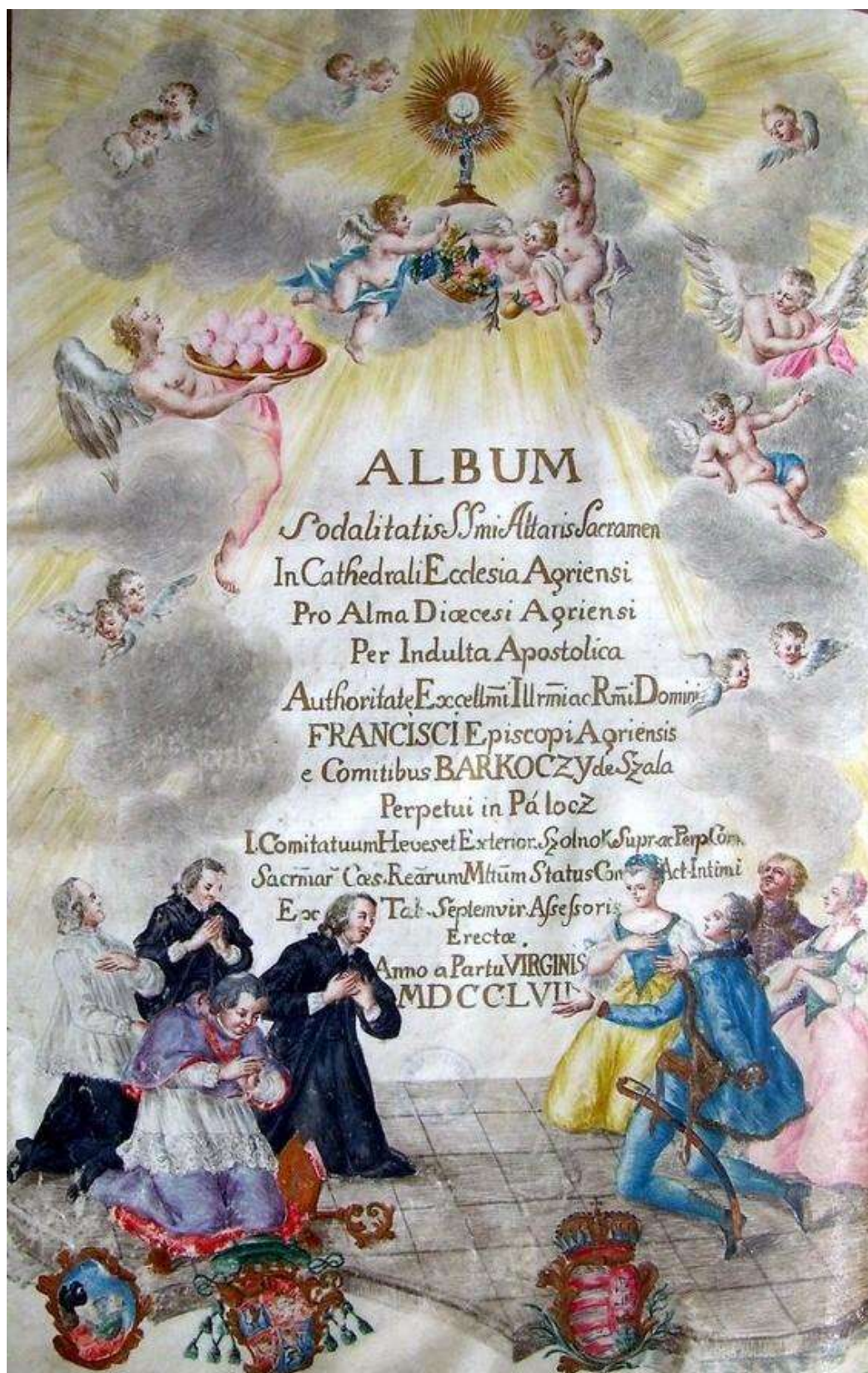
1. kép: A Barkóczy Album címoldala