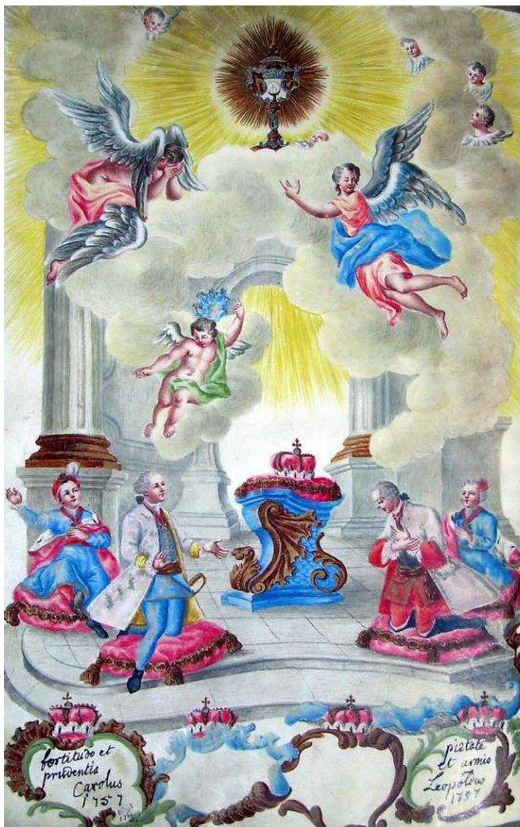
5. kép: Lotharingiai Ferenc István és Mária Terézia fűgyermekei