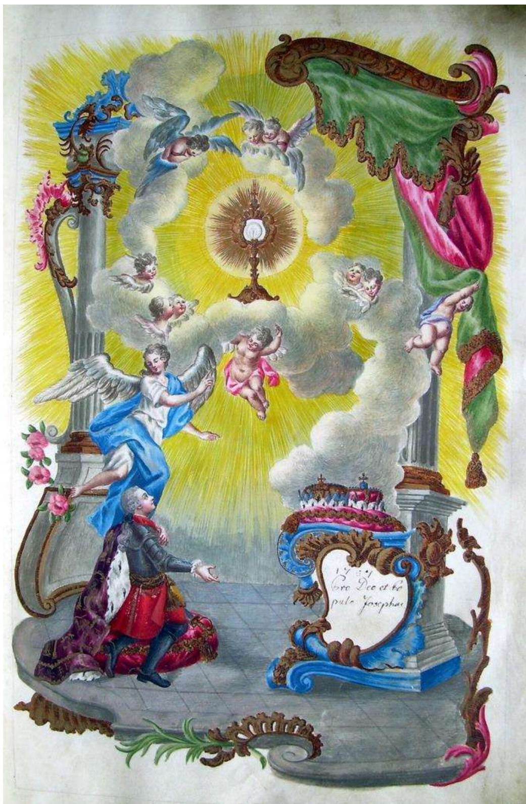
4. kép: Habsburg József főherceg