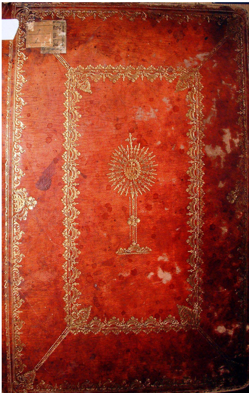
8. kép: A Barkóczy Album borítója