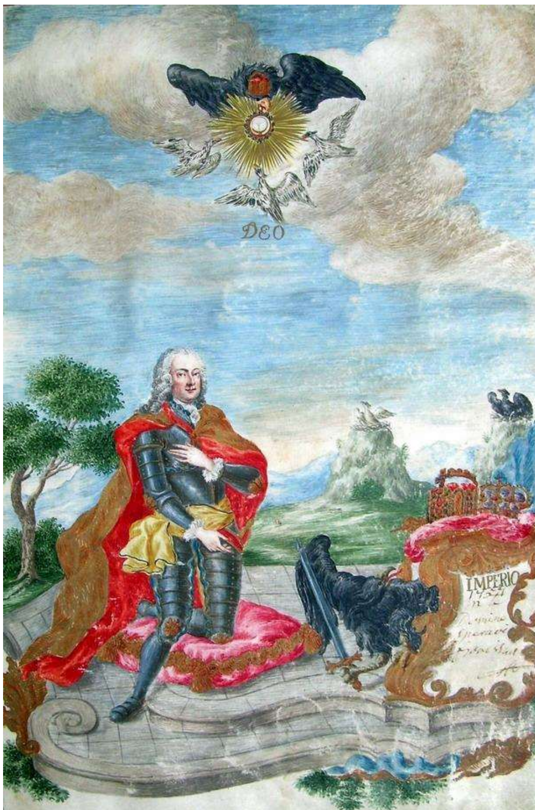
2. kép: Lotharingiai Ferenc István német–római császár