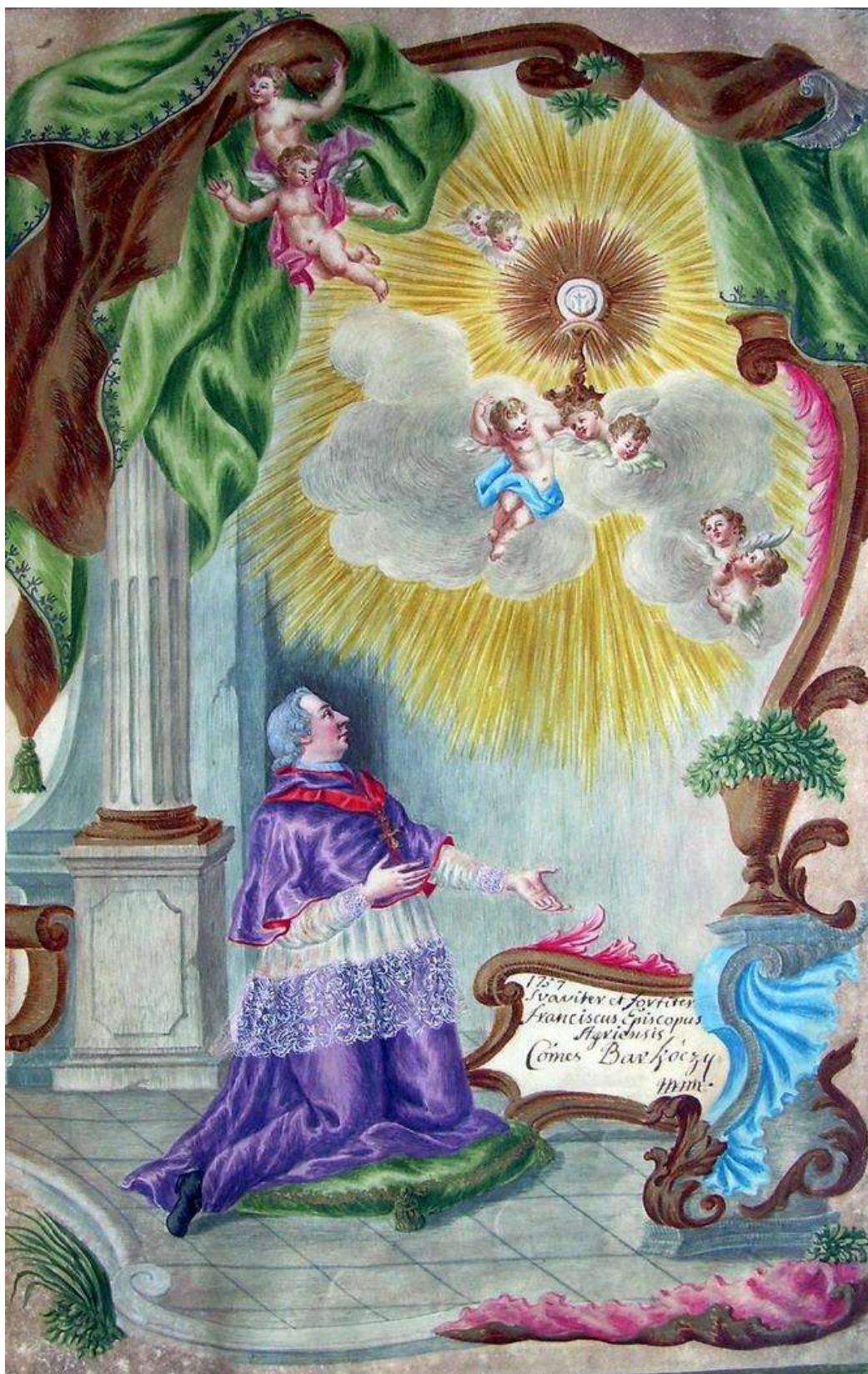
7. kép: Barkóczy Ferenc egri püspök