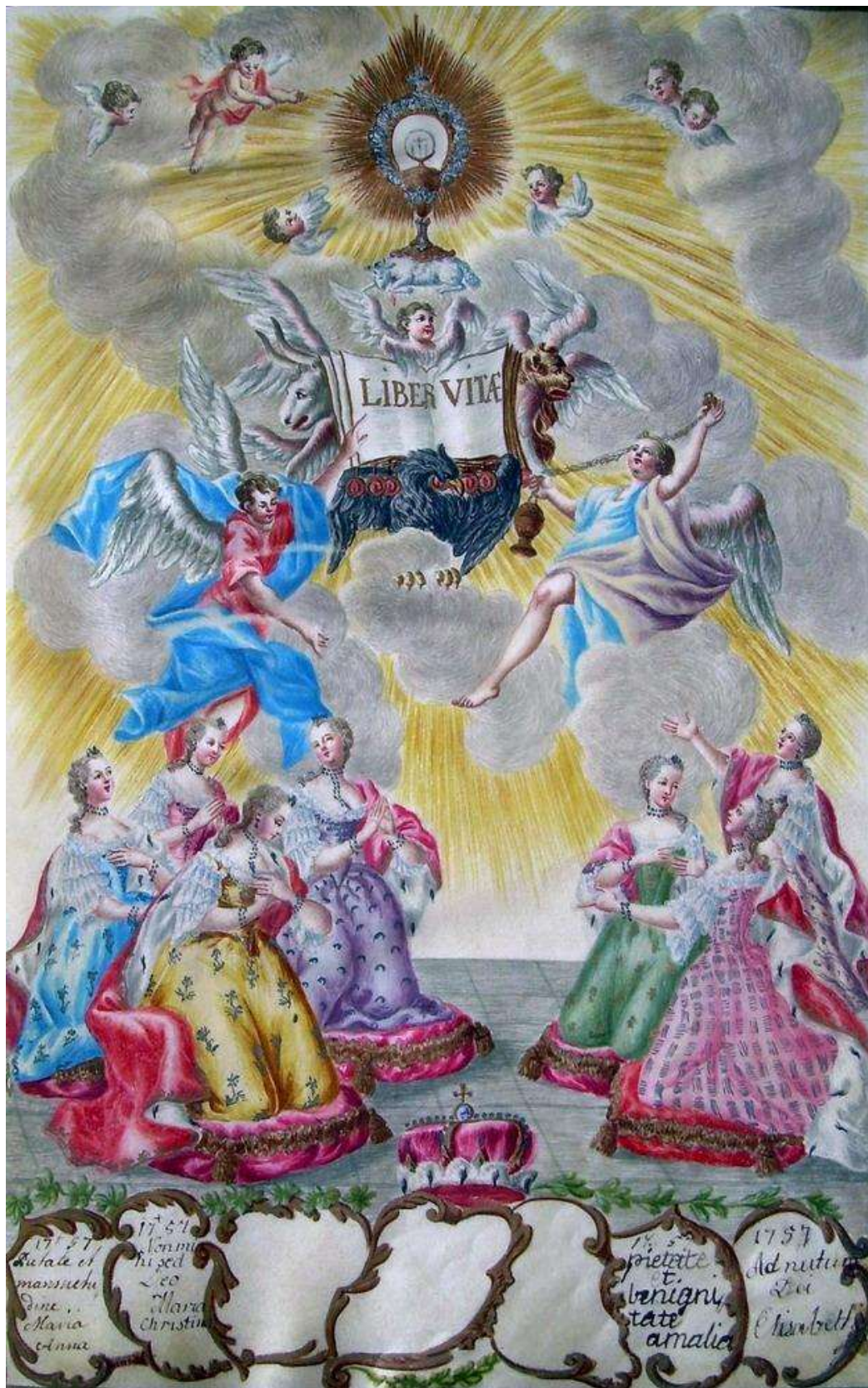
6. kép: A hét királyi hercegnő